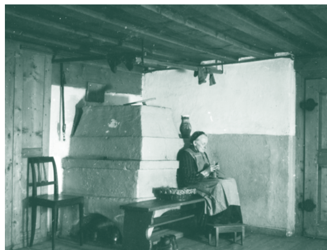
Am Kachelofen

Vor rund 800 Jahren begann man allmählich, in reichen Burgen und Bürgerhäusern, Wohnstuben und in ihnen die aus Backöfen weiter entwickelten Kachelöfen einzurichten. Die wurden von der Küche oder vom Gang aus beheizt, - die Abgase ließ man einfach durch die Feuertür und weiter durch das Gebälk entweichen; - Gegen 1700 etwa wurden die Öfen endlich an ein Kamin angeschlossen. Zudem war die Beschaffung von genügend Brennholz höchst arbeitsaufwendig, entsprechend kostspielig und erforderte großen Lagerbedarf. Überdies war die Isolierung der Wände, zumal der Fenster und Türen, höchst mangelhaft. Die „Klipsen“ und Spalte verstopfte man so gut es ging, - die „älteren Semester“ unter uns erinnern sich vielleicht noch, wie man vor Allerheiligen im Haslach Moos sowohl für Gräber wie für die Abdichtung der Zwischenräume zu den Vorfenstern holte, das man im Winter als