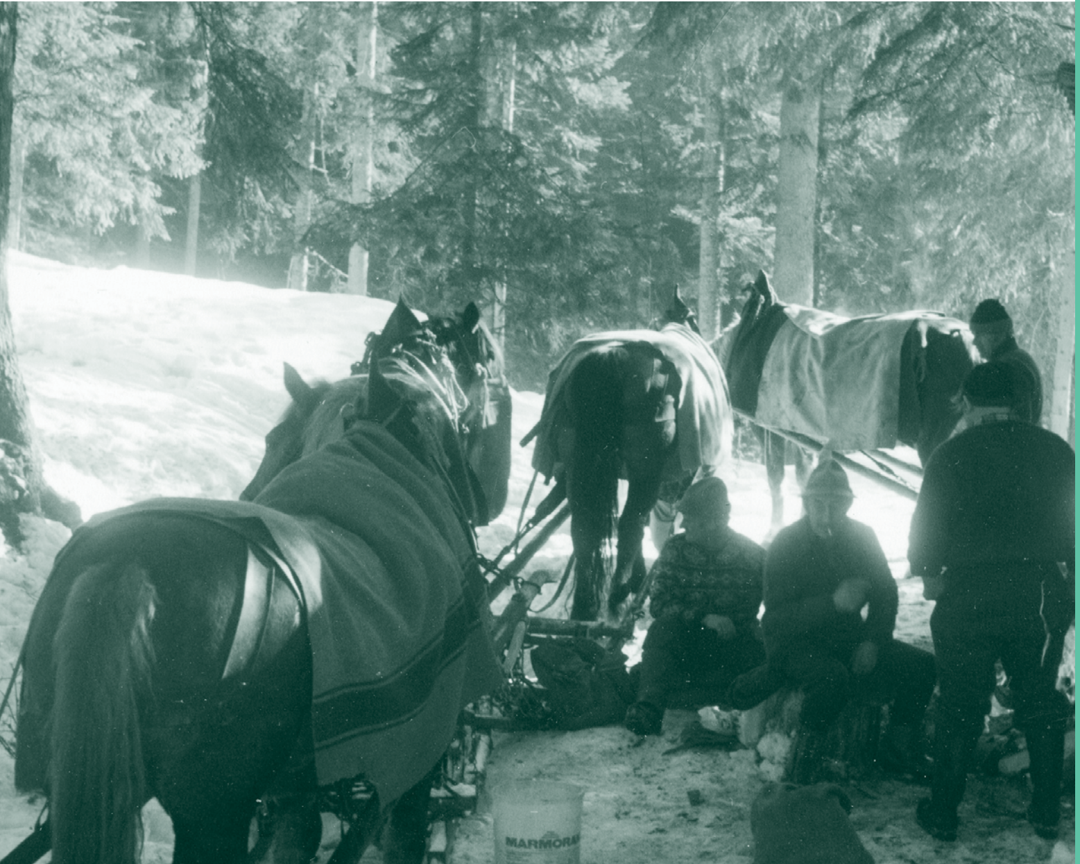
„Pfarregatter“ von Alfons Kräutler

Mit und für Senioren gestaltete Zeitung der Stadt Dornbirn Dezember 2007 / Nr. 53