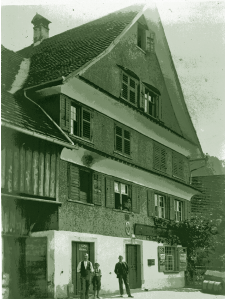
D'Leachare nach dem 1. Weltkrieg

Mit und für Senioren gestaltete Zeitung der Stadt Dornbirn Juni 2009 / Nr. 59