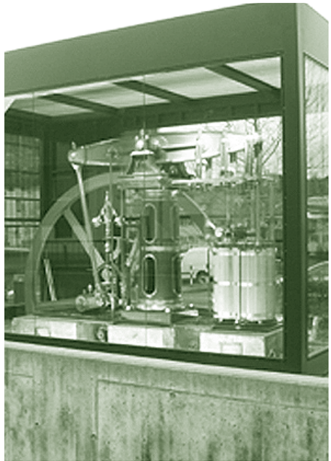
Die Kuhn 100 aus dem Jahre 1858

Wir hoffen, es bald der Öffentlichkeit übergeben zu können.