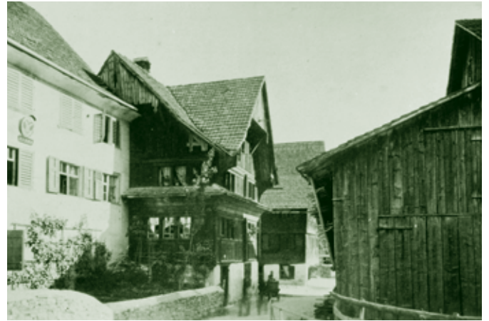
„Schmalzwinkel“, Klostersgasse / Winkelgasse

und an die Bauern verlost wurden. Die Straße verbindet die Jodok-Stülz-Straße westlich der Hatler Eisenbahn mit der langen Erlosenstraße.