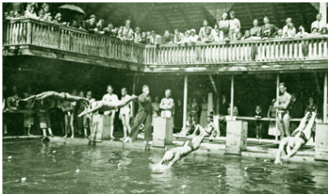
Schwimmbad Oberdorf 1937

Darüber hinaus waren die sogenannten „Luomlöcher“, aber auch die öffentlichen Gewässer, wie die Ploder der Dornbirner Ache, beliebte Treffpunkte für Badefreudige.