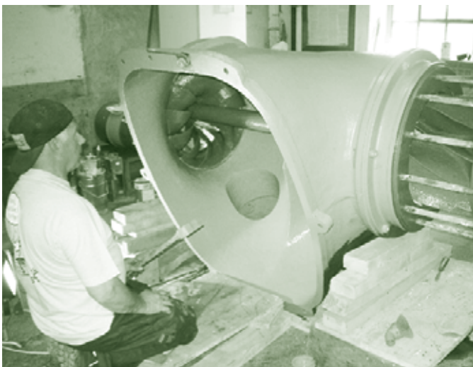
Bearbeitung der Turbine aus dem Jahre 1901

Unsere grauen Technikbegeisterten haben das älteste Dampfkraftwerk restauriert. Das Besondere an dieser Anlage ist, dass sie 1912 bereits als Wärme-Kraft-Koppelung ausgeführt wurde.