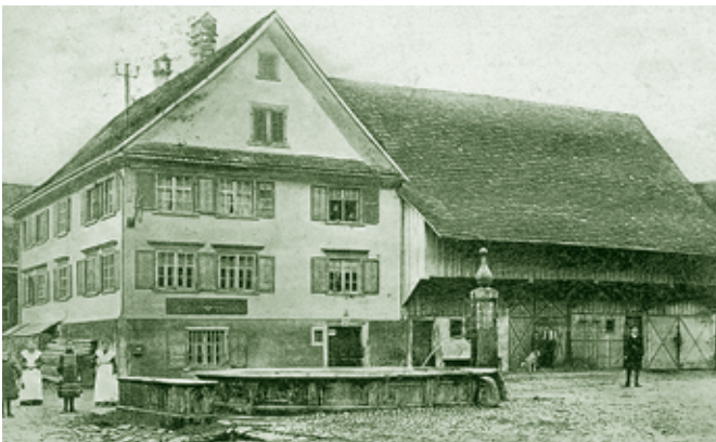
Gasthaus zum Adler, Adlergasse

Alte Erlosenstraße: Wohnstraße in der schon 1377 genannten „Erlose“ - , deren der Gemeinschaft gehörige Äcker einstens jährlich zum „Eren“ (mundartlich = pflügen) in Lose eingeteilt