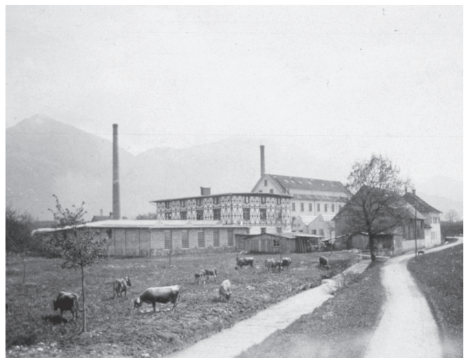
HERO Weberei Mittebrunnen, Bildgasse im Jahr 1899

Danach fließt der Müllerbach weiter Richtung Forach, wo sich noch ein weiteres Kleinkraftwerk, das von der Stadt Dornbirn betrieben wird, befindet. Der hier erzeugte Strom deckt den Jahresbedarf von rund vierzig Einfamilienhäusern. Dann mündet der Müllerbach in den Karlesgraben und danach in die Dornbirner Ach.