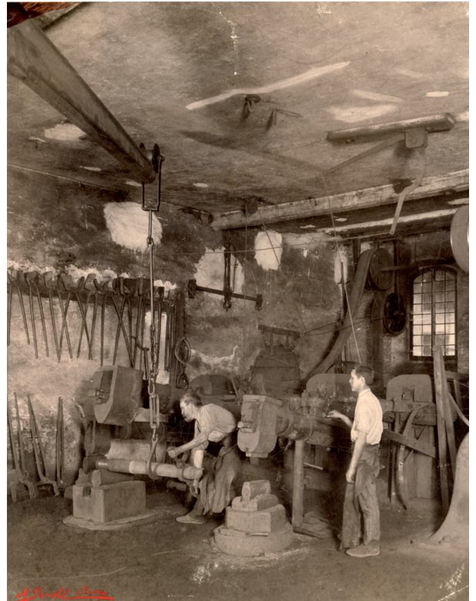
Die Hammerschmiede der Rüscher Werke um 1899

Unter der Leitung von Dr. Walter Krieg entwickelte sich das Museum weiter und wurde zu einem Zentrum der Umweltsorge. Dies führte zu einem vergrößerten Raumbedarf – ihm konnte schließlich durch eine Verlagerung in das Gebiet der