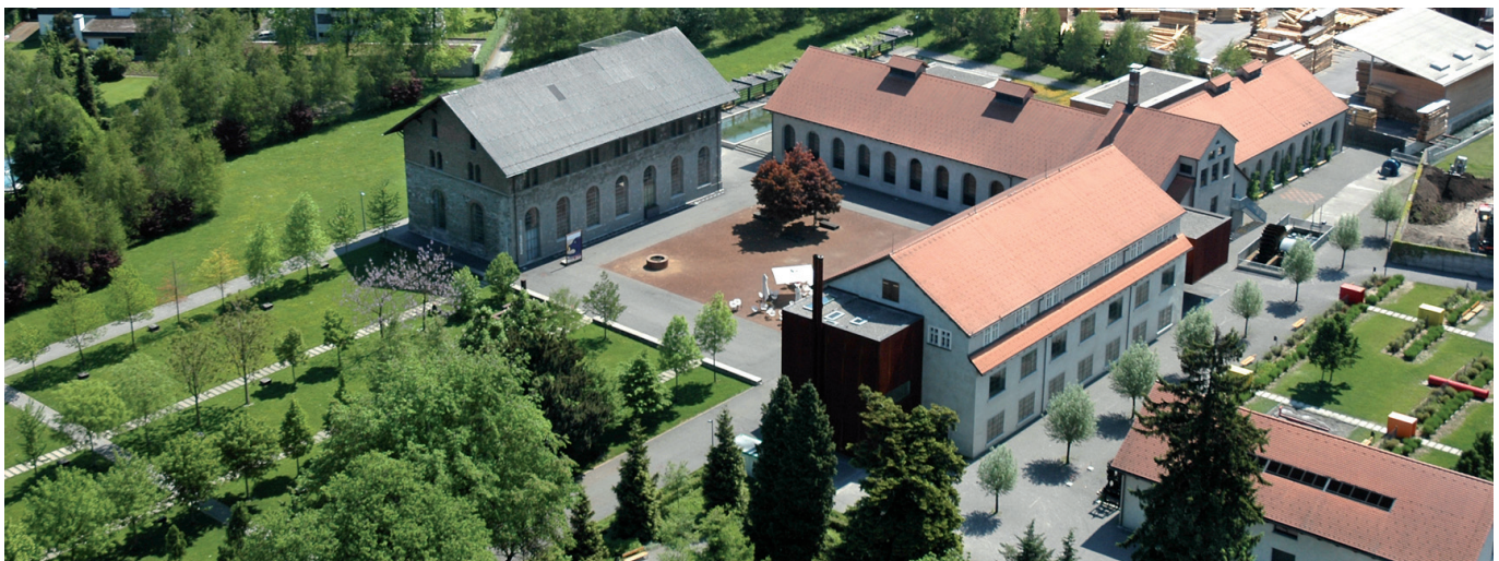
Naturmuseum „inatura“ als gelungene Nachnutzung eines ehemaligen Industriearbals

Rund 200 Jahre später, 1827, ließ sich der aus dem thurgauischen Münchwilen stammende Schmied Josef Ignaz Rüschi (1794-1855) in Dornbirn nieder. Mit seinem Vater Pankraz hatte er für den Textil-Unternehmer Carl Ulmer in Dornbirn eine Mühle gebaut. Der Bedarf der aufblühenden Textilwerke an Webstühlen und Ersatzteilen ermunterte ihn zum Ankauf der Schmelzhütten-Gründe mit einer Schmiede und einer großen, vom Wasser des Müllerbachs angetriebenen Sägerei. Trotz der Konkurrenz aus dem nahen Raum von Zürich und Winterthur baute er die Firma erfolgreich auf. Er heiratete in die angesehene Familie der Herburger ein, stellte eiserne Öfen und Herde her und lieferte Webstühle, Wasserkraftanlagen und Turbinen. Unter seinem Sohn Alfred wurde 1857 eine große Gießerei gebaut und 1897 erweitert, eine große Dampfmaschine ersetzte das Energieangebot des Müllerbachs für den mächtigen Eisenhammer, eine Großwerkstätte (1863), ein Gussmodellhaus (1873), eine Messinggießerei (1890) trugen dem Fortschritt Rechnung und machten die Fabrik zum größten Eisenbetrieb des Landes. Wie andere Firmen, so baute auch Rüschi für bewährte Dienstnehmer einige Arbeiterwohnungen in der Schmelzhüttenstraße. Eine gut ausgebildete, selbstbewusste Arbeiterschaft, die sich 1910 in einem dreimonatigen Streik erfolgreich durch-