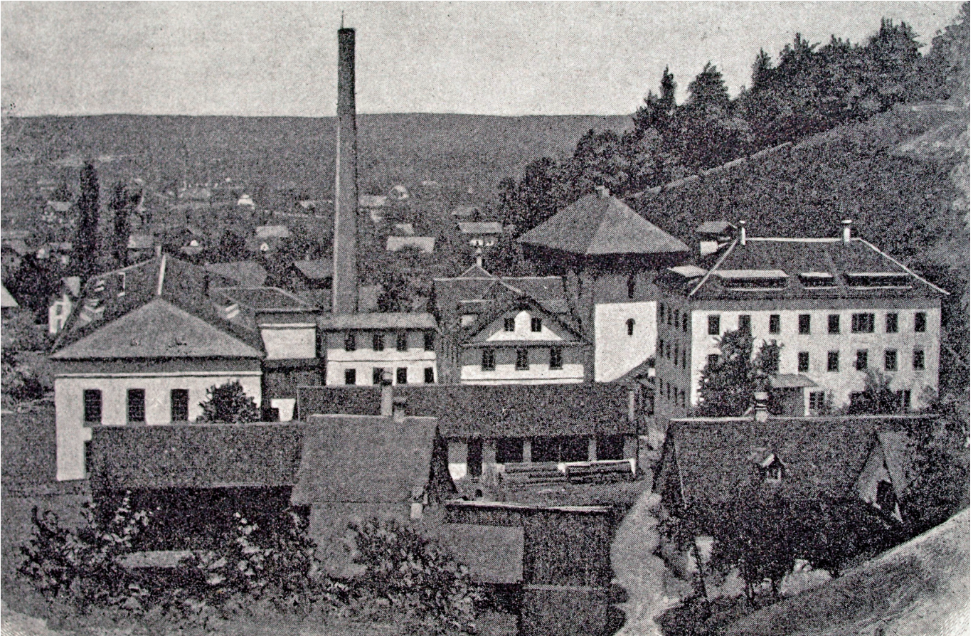
Die Fabrik Jos. And. Winder, Eulental im Jahr 1898

Das Wasser des Wappachbachs wurde oberhalb der ehemaligen Wetzsteinfabrik gefasst und in einer genieteten Druckrohrleitung zur Turbine geleitet. Für die Weberei wurden modernste Maschinen aus England angeschafft. Zur Veredelung der Stoffe wurde eine Indigoblau-Färberei und Appretur eingerichtet. Um in der wasserarmen Zeit ausreichend Antriebsenergie zur Verfügung stellen zu können, wurde schon 1860 die erste Dampfmaschine installiert.