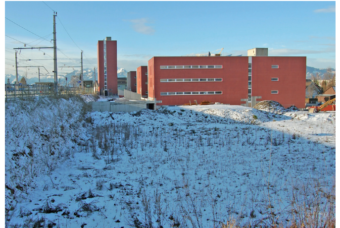
Standort für das neue Pflegeheim Birkenwiese

Im Jahr 2005 wurde das Pflegeheim Höchststraße eröffnet. In diesem Sommer wird das Seniorenhaus Birkenwiese bezogen. Nach dem bereits bestens bewährten Modell des Seniorenhauses Thomas-Rhomberg-Straße wurden zusammen mit der VOGEWOSI weitere 30 Wohnungen für Senioren geschaffen. 14 Wohnungen sind für Menschen vorgesehen, die bereits einen leichten Betreuungsbedarf haben. Sie werden bei den Aktivitäten des täglichen Lebens von einem Betreuungsteam vor Ort unterstützt. Die restlichen 16 Wohnungen sind für selbständige Senioren