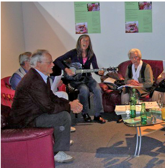
Wer ehrenamtlich hilft, profitiert selbst am meisten