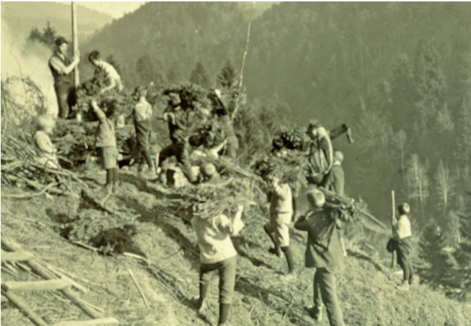
Arbeiter der Rüscher-Werke

Diese vierunddreißig Arbeiter der „Maschinenfabrik und Giesserei“ posierten mit verschiedenen Werkstücken und Werkzeugen für ein Gruppenbild im Rüscher-Werke-Areal.