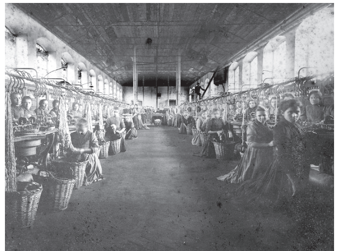
Seidenspinnerinnen in der Firma J.G Ulmer, Schwefel

Durch Firmenfestschriften und vor allem durch die Monographien und Artikel von Hubert Weitensfelder wissen wir einiges über die Entstehung und die Hochblüte der Textilindustrie in Dornbirn. Doch die Geschichte der Textilindustrie in Dornbirn ist damit noch keineswegs endgültig geschrieben. Das Stadtarchiv bemüht sich durch die Bewahrung bedeutender Unternehmensarchive. Hier sind vor allem das Archiv der Firma Herrburger & Rhomberg sowie das Firmenarchiv von J.M. Fussenegger anzusprechen, das historische Wissen zu sammeln. Gleichzeitig sind wir aber auch bemüht, von privater Seite durch Interviews, Fotografien und Dokumente weitere Quellen zur Arbeitswelt zu sichern.