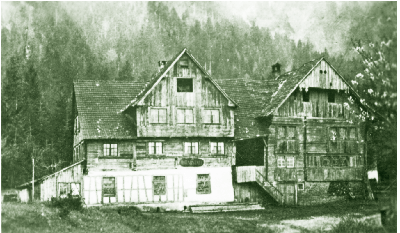
Bad Haslach - 1880