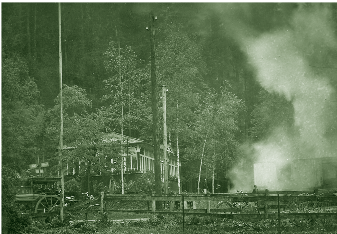
Brand beim Bad Haslach - 1929