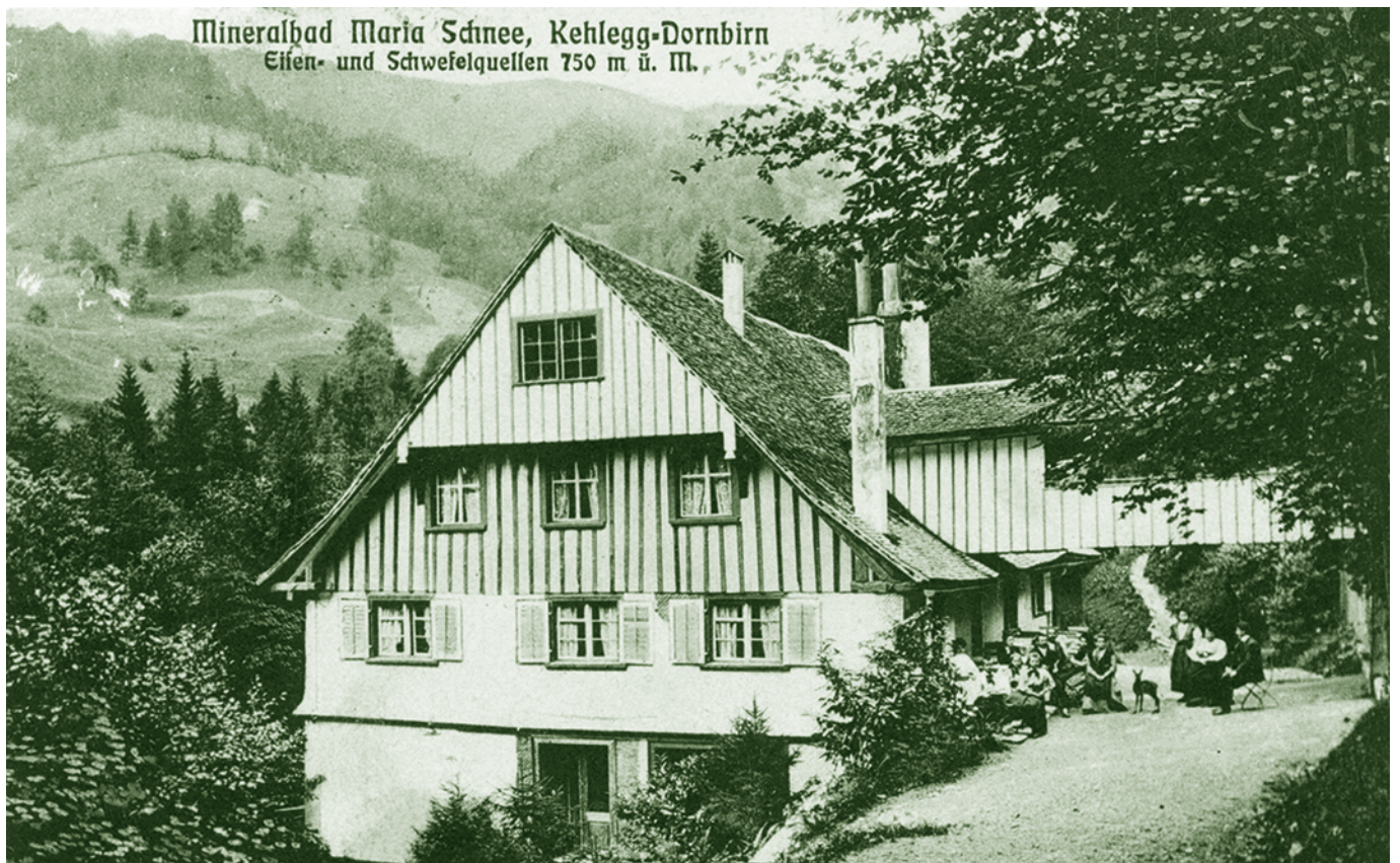
Bad Kehlegg nach 1904

Fotos von den „Badern“, Heilpraktikern, Therapeuten, Masseuren und Badenden sowie Innenaufnahmen mit Wannen und der Badebetrieb des Dornbirner Krankenhauses würden uns sehr interessieren.