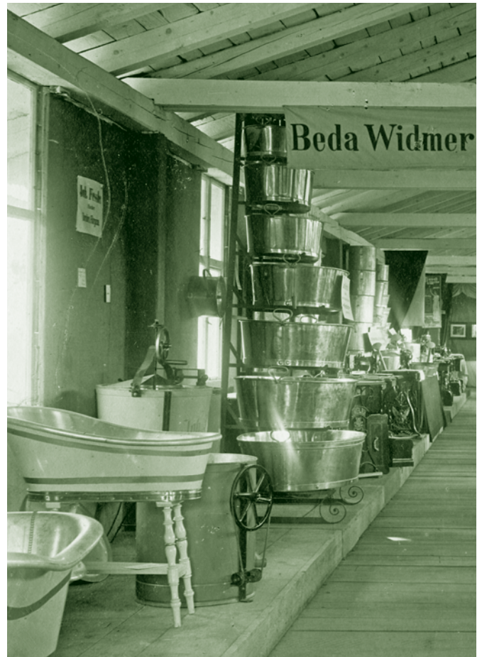
Ausstellungsobjekte der Fa. Johann Fessler, Flaschner, während der Gewerbeausstellung - 1900

Keine Frage: die Frauen, die Mütter haben in der Regel für Sauberkeit und Hygiene gesorgt. Die Buben leckten ihre Schrammen wohl ab oder versuchten darauf zu biseln; aber wenn sie „Stumpolöchor“ (=Fußverletzungen beim Barfußgehen) aus dem Streueried mitbrachten, mit einer „Blesse“ (=Verletzung), einer schmerzende „Fläre“ (=Aufschürfung) kamen, einen „vrrofoto Butzo“ (=Blutkruste auf einer entzündeten Stellen) aufgekratzt hatten; wenn die Mädchen, - mit allerlei „Ok und Weh“, wegen einer „ufgripsoto Blotoro“ (aufgescheuerte Blase), oder „anam Feahl“ (=Wundblase) weinte, - die Mutter musste dafür sorgen, dass die „Wehle und Behle“ (kleinen Verletzungen) mit Schnaps oder Kamillentee gewaschen wurden und nicht „verwilderten“ (=sich entzündeten);