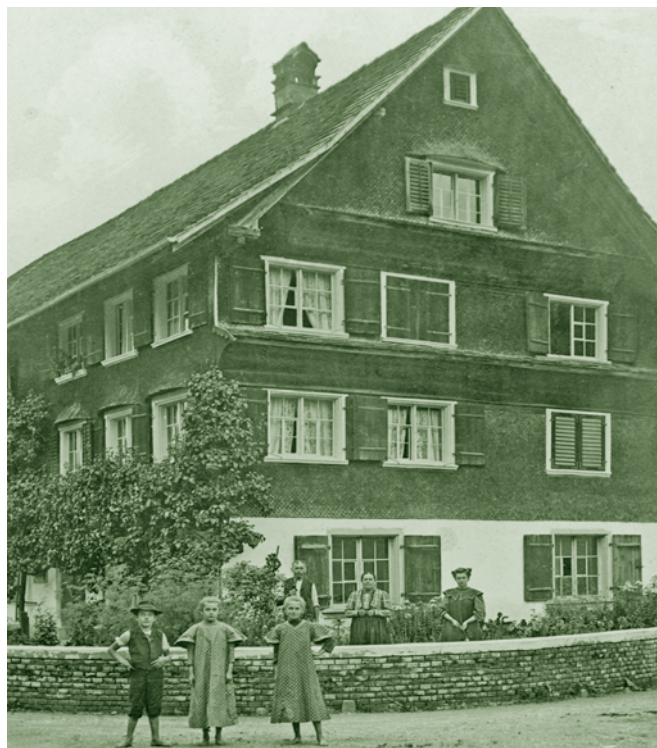
Mittelfeldstraße 15 - um 1910

In den Jahren vor 1800 wurden viel mehr Häuser aus Holz gebaut. Für den Innenputz benötigte der „Stokodorar“ viel Gips.