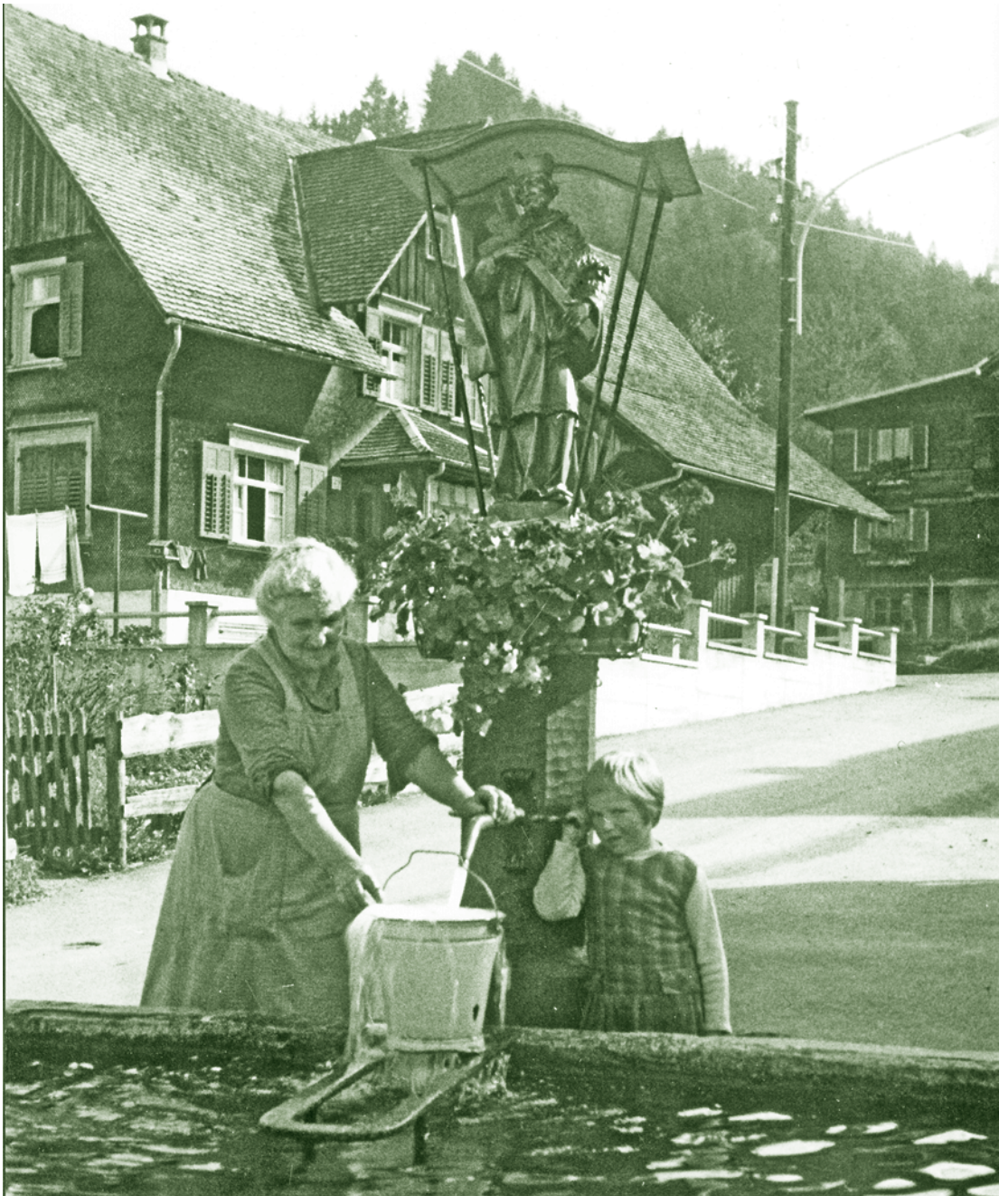
Am Mühlebacher Brunnen

Mit und für Senioren gestaltete Zeitung der Stadt Dornbirn Juni 2010 / Nr. 63