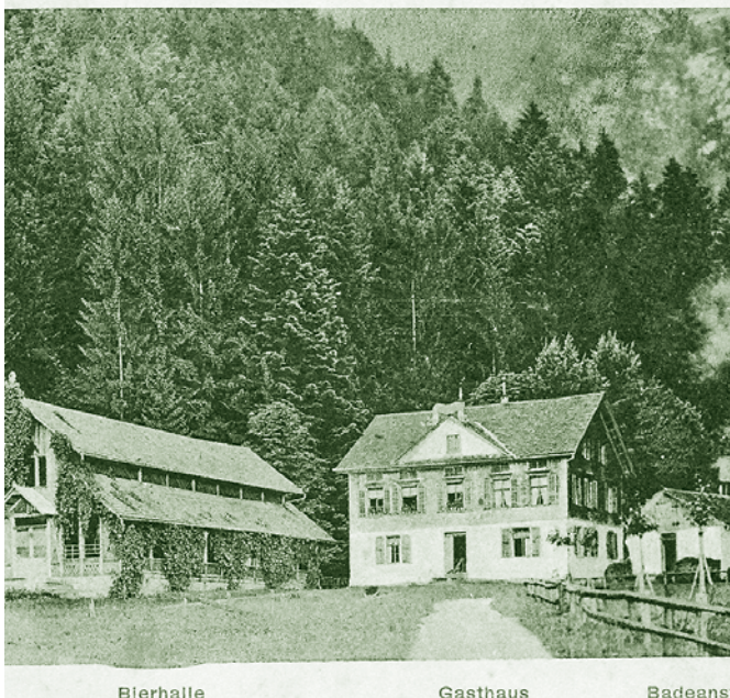
Bad Haslach - 1910