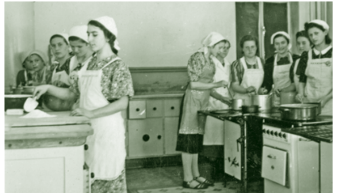
Schülerinnen der Hauswirtschaftlichen Berufsschule - 1940