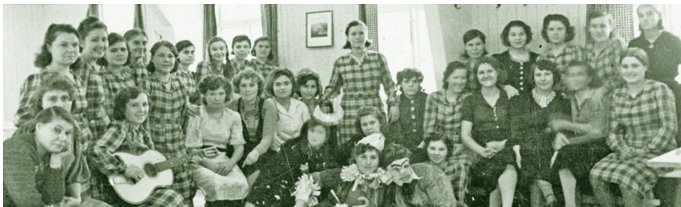
Textilbetrieb-Zwangsarbeiterinnen um 1944