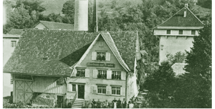
„Schrepfers“, Steinebach 13 - um 1910