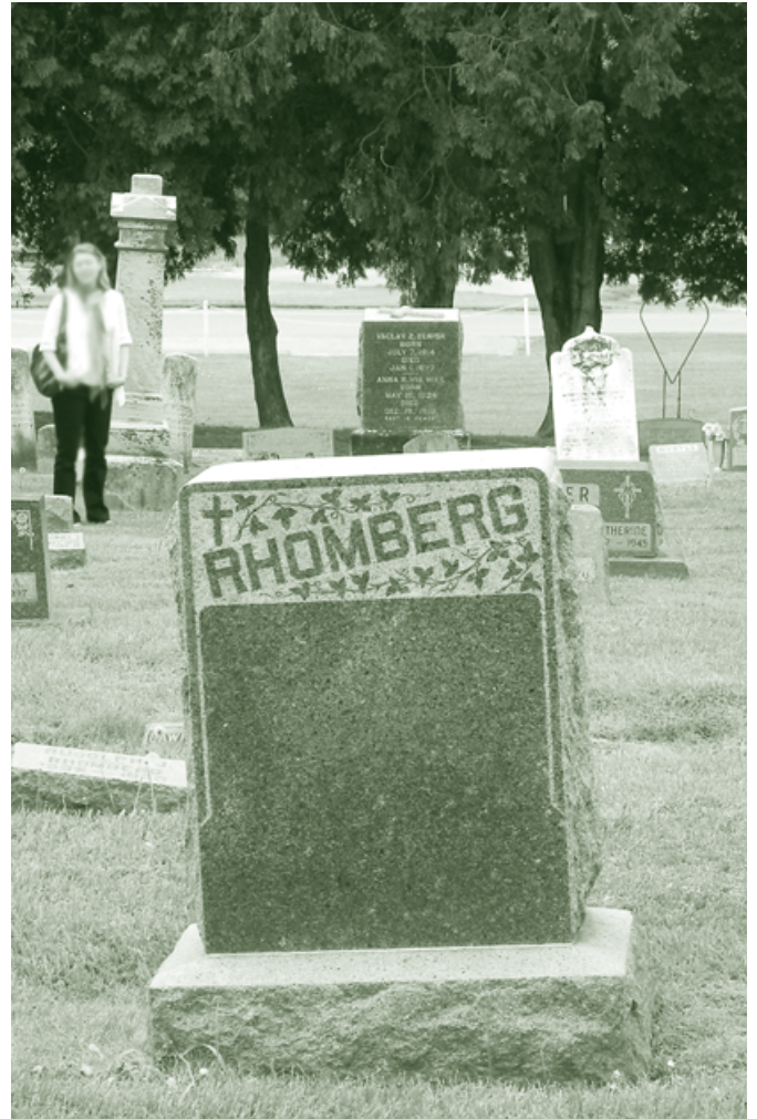
Friedhof in Dubuque - Mai 2010

willkommen sind, haben sie neue Lebensperspektiven und werden sich leichter integrieren. Es gibt zahlreiche positive Beispiele gelebter Integration. Immer wieder begegnen mir türkische Mitbürger-