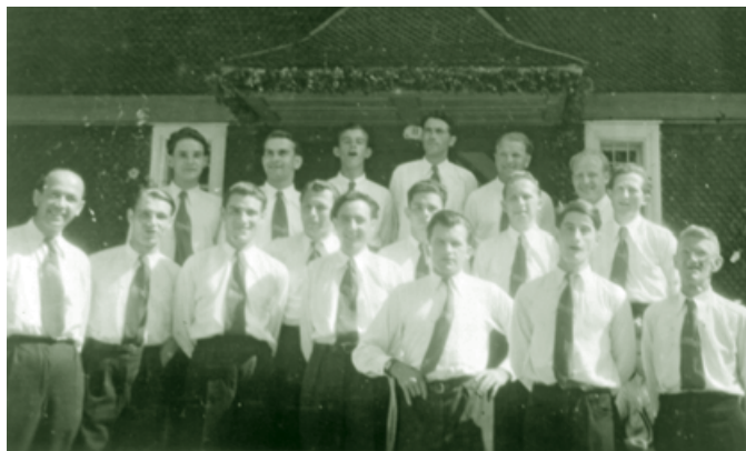
Die „Vogelweider“ - 1950

„...das allerschönste Stück davon, ist doch die Heimat mein“ heißt es in dem bekannten Südtirolerlied. Mehr als 10.000 Südtirolerinnen und Südtiroler haben diese ihre Heimat unter „Zwang“ aufgegeben und wurden auf Grund des Hitler-Mussolini Abkommens von 1939 nach Vorarlberg umgesiedelt. Rund 2000 von ihnen ließen sich in Dornbirn nieder. Ein Bauboom setzte ein, der Bau der Südtirolersiedlungen begann. 122 Häuser mit rund 600 Wohnungen wurden in der Sala, Kehlen, Egeten und Rüttensch errichtet.