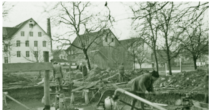
Bau der Sala-Siedlung - 1939