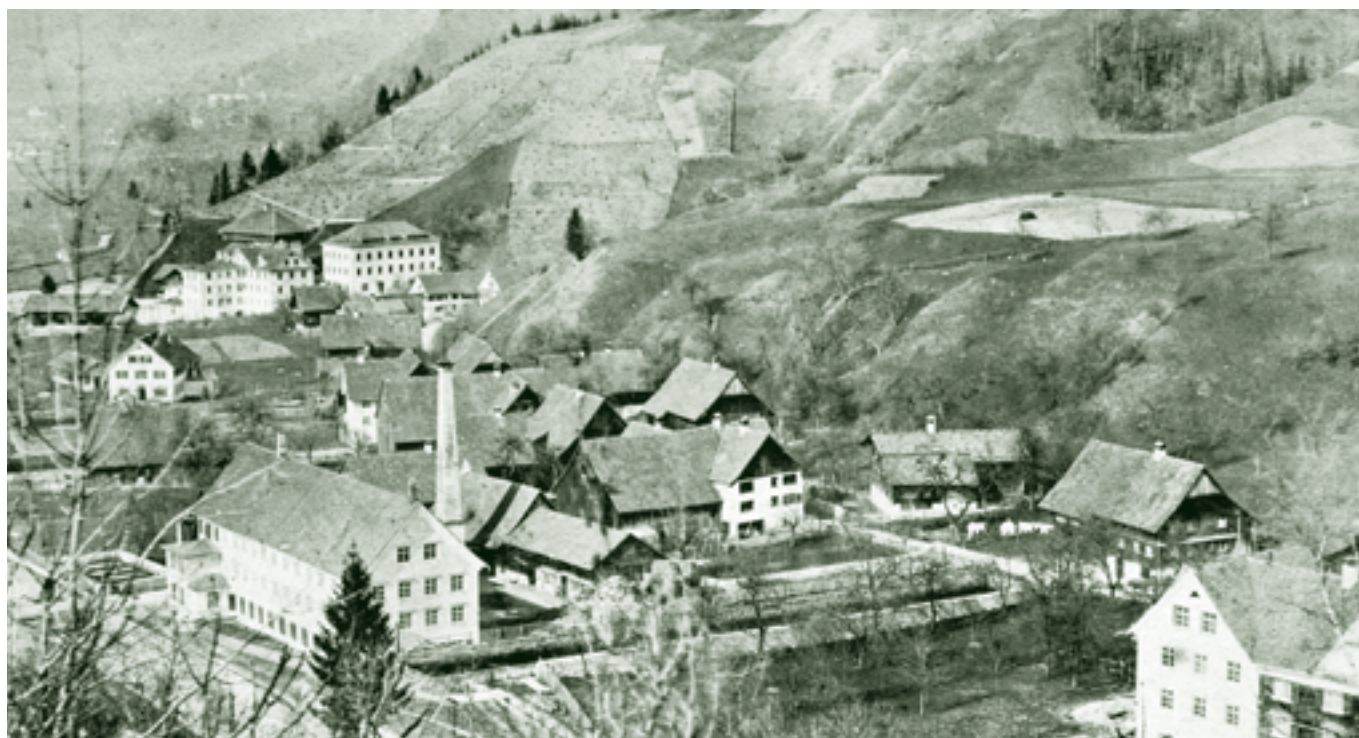
Eulental, Weinberge am Romberg um 1870

In den Zeitgerichtbeschlüssen aus dem Jahr 1686 stehen weitere interessante Details. Im Vorjahr waren rund 25 Dornbirner wegen Stickelverkaufs bestraft worden. Diejenigen, die Stickel oberhalb vom Kobler Moos, von Müsel und Gunzmoos ge-