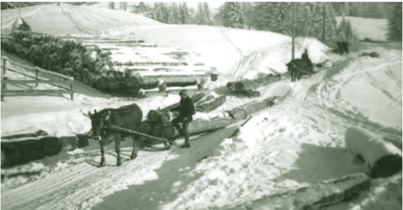
Winter - Holz ziehen