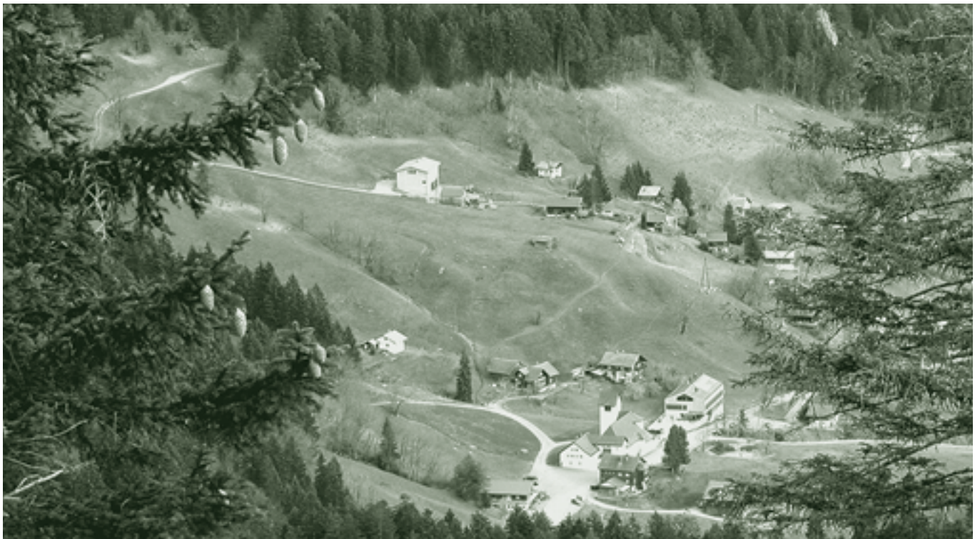
Das Walser Bergdorf Ebnit

Die Etappe 9 beginnt in Viktorsberg und führt zunächst in das „Kriasidorf“ Fraxern. Von dort wird unsere Kondition auf einem alten Säumerweg bis zur Hohen Kugel gefordert. Entschädigt werden wir auf der ganzen Tour von einem traumhaften Panoramablick. Über das Fluher Eck führt der Weg in das Walser Bergdorf Ebnit. Von der ausichtsreichen Hohen Kugel haben wir u.a. einen schönen Blick auf das Bergdorf Meschach, von dem eine Urkunde von 1398 erstmals die Anwesenheit von Walsern bezeugt. Das Fluher Eck hingegen dürfte über Jahrhunderte hinweg die wichtigste Wegverbindung der Ebniter „ans Land“ gewesen sein und wird auch den Walser Einwanderern, die in einem Erblehensvertrag von 1351 für Ebnit erstmals belegt sind, den Weg gewiesen haben.