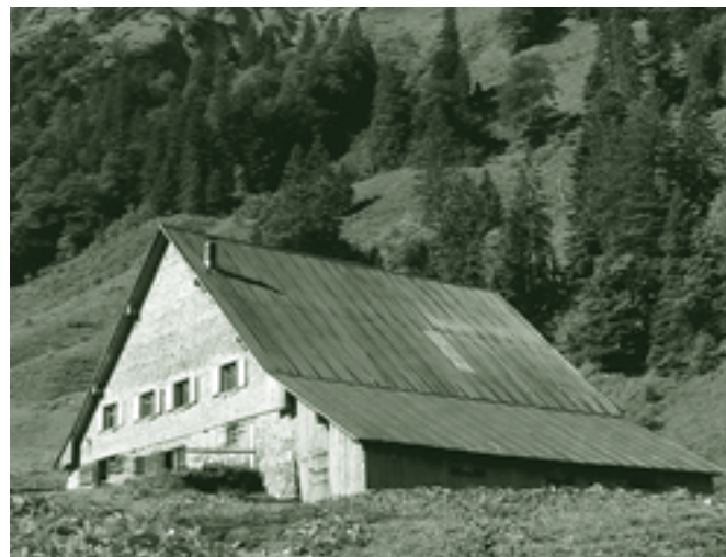
Alpe Unterfluh - um 2000