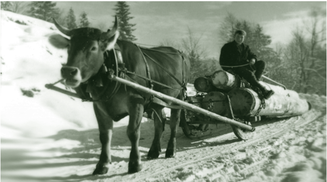
Holzarbeiten im Winter

Heute ist die alte Zeit Nostalgie. Den Transport übernehmen Kranwagen. Traktoren mit Seilwinden, oder Seilbahnen erreichen weit entfernte Ziele. Der Fortschritt der Technik hat die Holzurückung der Pferde in unwegsames Gelände verdrängt.