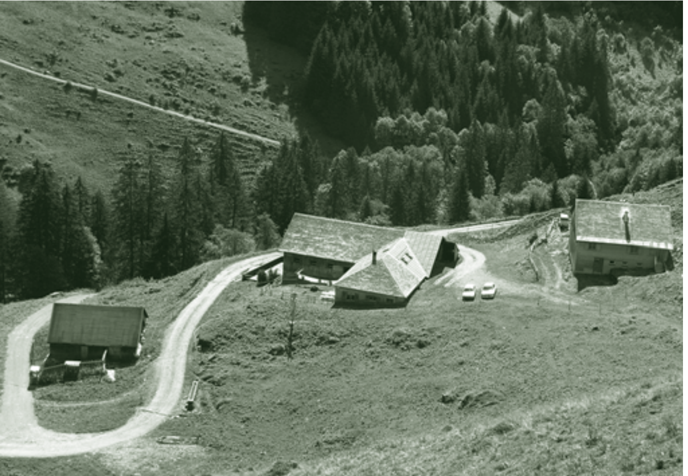
Lindachalpe im Mellental

Die Etappe 10 startet bei der Kirche in Ebnit und führt auf einsamen Wegen über den First, und weiter durch das stille Mellental mit den beiden Walser Alpsiedlungen Lindach- und Hauseralpe bis nach Mellau. Eine schöne und anstrengende Tour, die vor allem am Ende einiges an Kondition abverlangt. Vor dieser Tour ist es äußerst lohnenswert, das Buch „Entwicklung der Alpwirtschaft am Dornbirner First“ von Martin Wohlgenannt zu lesen. Zunächst führt uns der Weg über die Sattel- und Unterfluhalpe hinauf zum Fluhlöchle. Der beeindruckende ehemalige Alpweg zur Altenhofalpe zählt zu den schönsten Abschnitten des Weges. Die Hochebene zwischen Altenhof- und Körbalpe ist nicht nur dank drei größerer Moorkomplexe, sondern auch aufgrund der fehlenden Fahrwege eine besonders beeindruckende Landschaft. Ab der Haslachelpe stoßen wir wieder auf Spuren von Walsern. Ludwig Welti schrieb im Jahr 1965 einen Beitrag „Das Mellental als Kontaktzone zwischen Wäldern - Rätoromanen - Walsern und Rheintalern“. Heute besteht das Mellental aus 46 Alpen und insgesamt 27 Voralpen, die zu einem