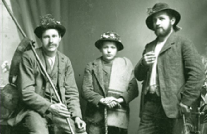
Alphirten - um 1912

von uns auch „Guntental“ genannt wurde. Dort entstanden später eigene Alpen, die jetzt den Mellauern gehören.