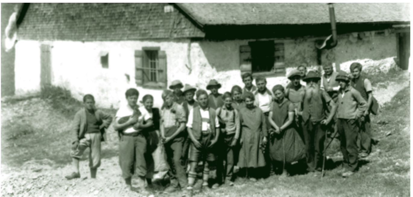
Alpe Schöner Wald - 1930-er Jahre

Immer öfter wurde mir bewusst, dass ich mich von vielem mir Liebgewordenem bald trennen muss, insbesondere von dem im ersten Morgenlicht zuerst rosa, dann goldenen Freschen und seinem abendlichen, blauen Leuchten. Und dem mir unbekanntem Älpler, der oftmals zum Dank für einen geglückten Tag den abendlichen Alpsegen, von der „Alpe Hauser“ gut hörbar, über das ganze Tal rief, ihn werde ich wohl nie mehr hören.