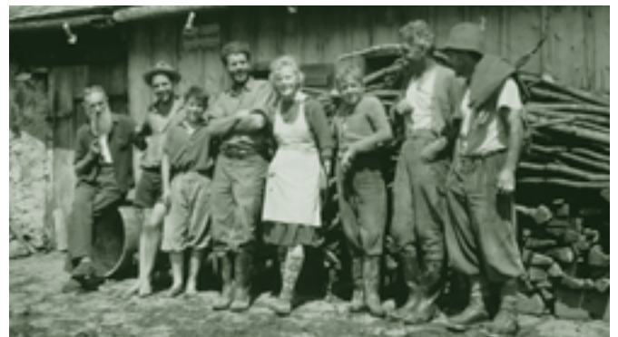
Alpe Altenhof - 1957

Im Mellental kennen wir die Alpe Güntenstall und den Gunten. Da Alpställe vor der Labkäserei nicht üblich waren, ist es denkbar, dass das Mellental