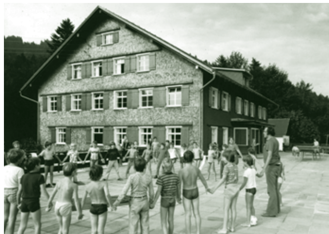
Kreisspiele auf der Terrasse des Ferienheims Maien, 1970er

Der absolute Höhepunkt des Maien-Aufenthaltes war der Abschlussabend im Turnsaal, so zwei Tage vor der Abreise. Dafür wurde auch mit Feuereifer tagelang gebastelt, anprobiert und geprobt. Die