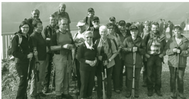
Gemeinsames Wandern während der geführten Wanderwoche

Unsere Wanderer sind heutzutage top ausgerüstet. d.h. mit sehr guter Regenschutzbekleidung, mindestens knöchelhohen Wanderschuhen, Kopfbedeckung, Wanderstöcken, Rucksäcken und Getränkeflaschen. Gewandert wird meist bei jedem Wetter, denn unsere Wanderer sind sehr wetterfest. Die Beliebtheit unseres Wanderwochen zeigt sich darin, dass diese schon im Dezember gleich ausgebucht sind, kurz nach der Ausschreibung für das folgende Jahr. Allerdings werden dann später immer wieder Plätze frei, denn bei Senioren kann sich in einem halben Jahr doch einiges ändern.