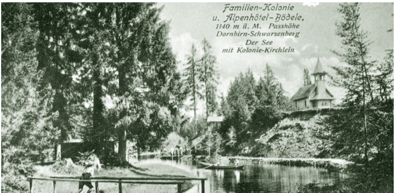
Bödelesee im Sommer um 1910