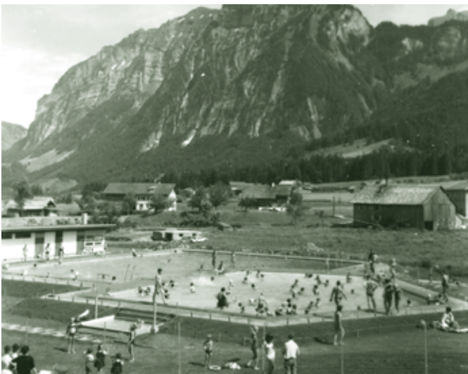
Blick auf das Mellauer Bad mit Kanisfluh um 1950