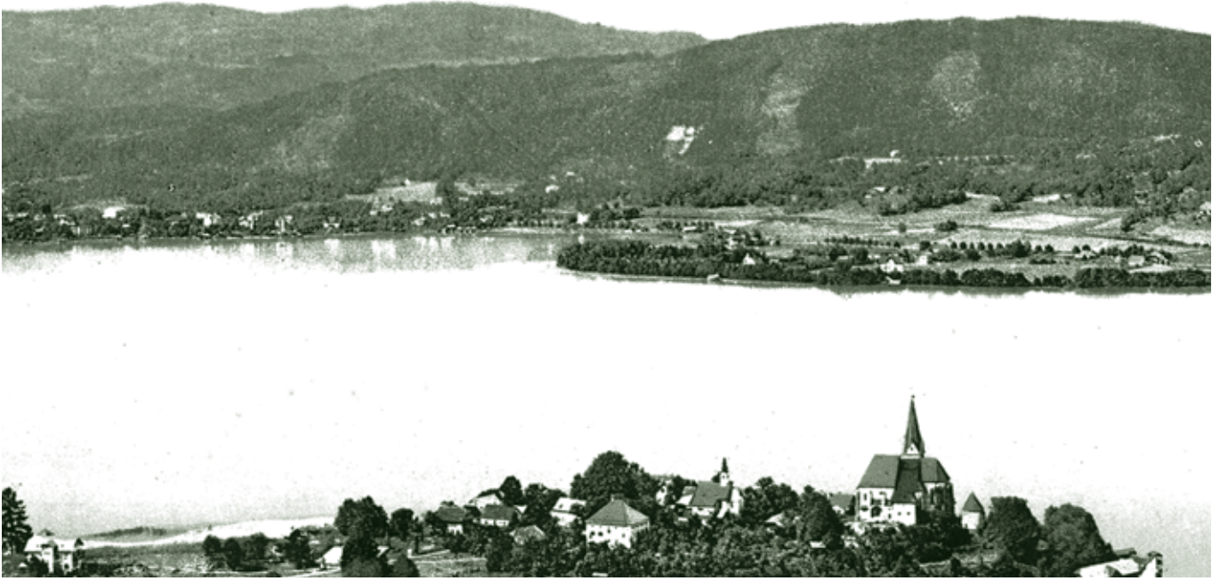
Wörthersee und Maria Wörth - 1908

Nacht im Zimmer unseres Vaters schlafen. Am Tag benutzten wir die Matzratzen zum Baden im Wörthersee, dann wurden sie schnell getrocknet und als Schlafstätte hergerichtet. Mein Vater ärgerte sich maßlos, dass wir für das Schlafen auf unserer Luftmatzratze auch noch etwas bezahlen mussten. Nichts desto trotz genossen wir das Baden im See und bewunderten die tollen Motorboote und die Wasserschifahrer. Wir fuhren rund um den Wörthersee nach Velden, Maria Wörth und Pörschach und schauten uns die tollen Hotels mit ihren Parkanlagen von außen an. Ganz ehrlich, ich beneidete die reichen Leute, die sich einen Urlaub in so teuren Hotels leisten konnten. Zurück ging es über den Katschberg nach Salzburg. Bei dieser Bergstrecke hatten wir weniger Glück. Eine Zündkerze ging kaputt und auf drei Kerzen schaffte der Steyr den Katschberg nicht. Um Gewicht zu sparen, wurden wir beiden Buben sowie Tante und Onkel in den Postbus verfrachtet, um bis in den Lungau zu fahren. Mein Vater fuhr im Rückwärtsgang den Katschberg hinauf und war froh, dass ihm die Deutschen, die ja nach seiner Meinung nicht „Bergfahren“ konnten, schieben halfen. Wir übernachteten im Lungau, das Auto wurde wieder auf Vordermann gebracht und am nächsten Tag fuhren wir Gott sei Dank ohne weitere Komplikationen ins Ländle zurück. Zwei Tage Anreise, zwei Tage Rückreise und drei Tage Badeurlaub, das war für uns das Non plus ultra im Jahr 1955.