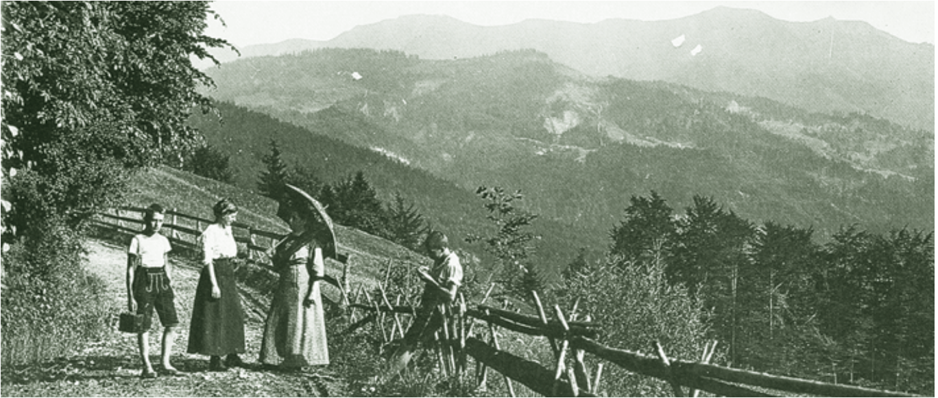
Beim Spaziergang in Kehlegg, August 1912