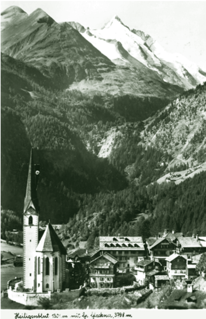
Blick auf Heiligenblut mit Großglockner, Ende 1930er Jahre

So brauchten wir 1955 an den Wörthersee ganze zwei Tage Anreise. Wir hatten einen Steyr 50, in dem eigentlich 4 Personen so leidlich Platz hatten. Aber für den Urlaub füllte man das Auto mit 5 Personen und Gepäck bis an den Rand, sodass mein Vater beim Fahren den Rückspiegel nie benutzen konnte. Da wir zuhause eine Wirtschaft