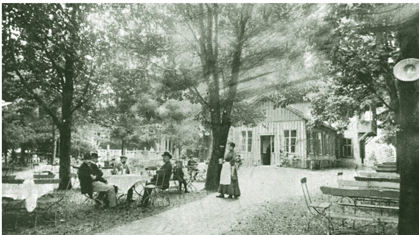
Bierhalle am Bahnhof um 1900

Selbstverständlich fehlte es auch nicht an Jugendlichen „mit am urüobigo Kopf“ - „wüdrig“ nach der weiten Welt. Da musste mancher wohl einmal hören: „Gang a Gott’s Nammo, so wit de