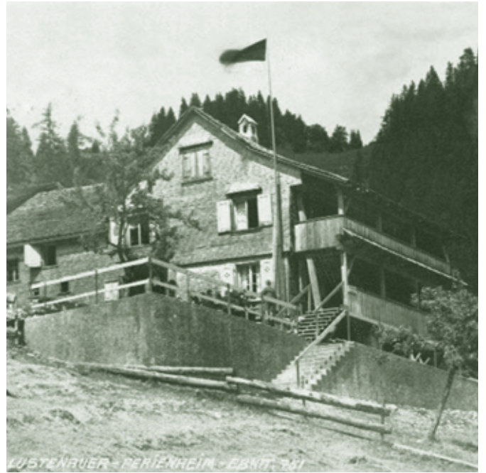
Lustenauer Ferienheim im Ebnit

Quellen: mündliche Überlieferung und Franz Albrich in Dornbirner Schriften Nr. 28