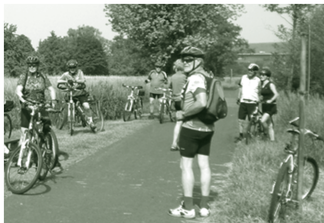
Radwoche Mosel im Frühjahr 2012

Die Ziele unserer begleiteten Radwochen sind vor allem Österreich oder Deutschland. Die modernen Fahrradanhänger unserer heimischen Busunternehmen können 36-40 Fahrräder aufnehmen.