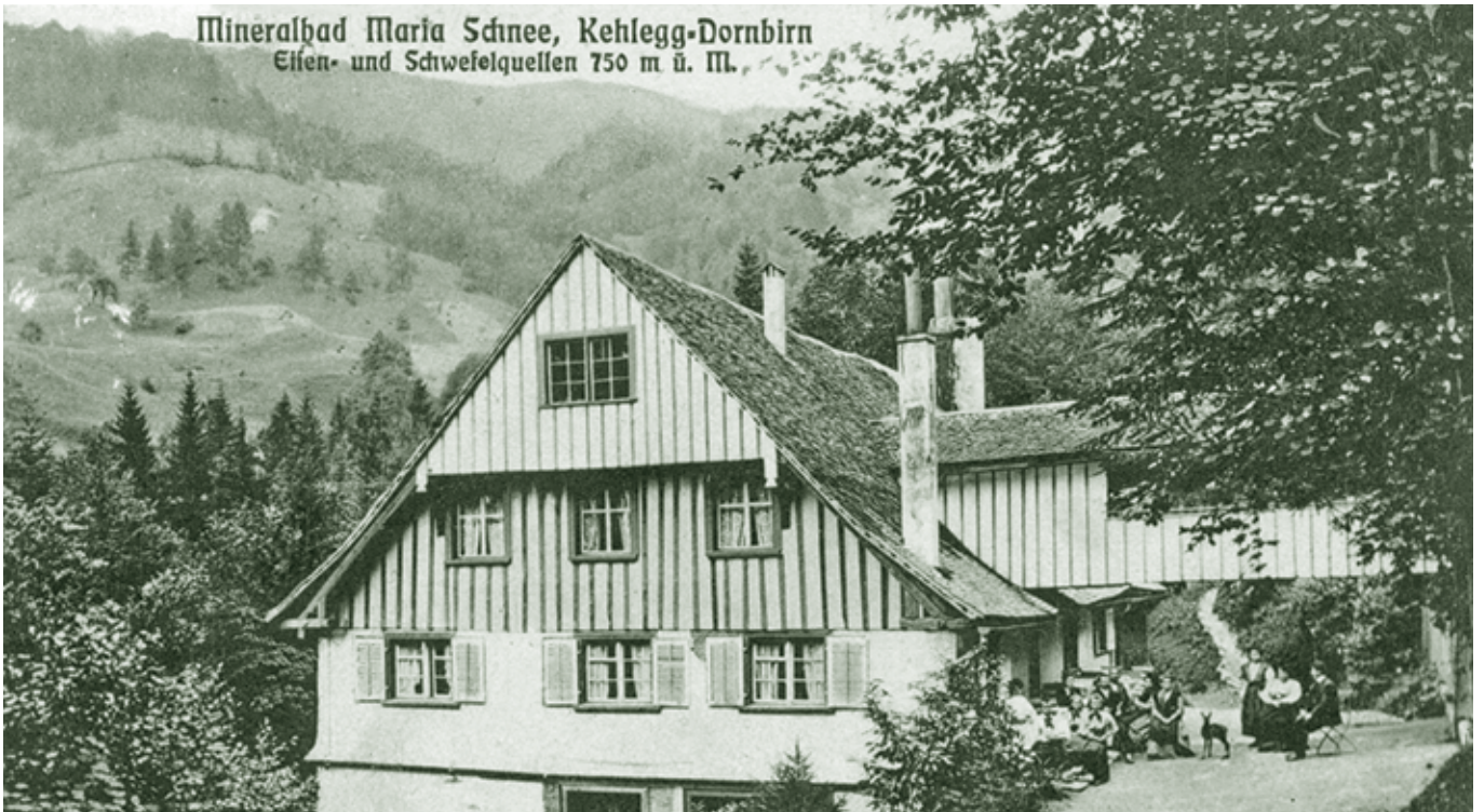
Bad Kehlegg um 1910

mals weltberühmten Bades Pfäfers bei Ragaz. Das Wasser sei nicht nur zum Baden, sondern auch für Trinkkuren zu gebrauchen. Mit solchen Kuren könne man tiefende Augen, Leber, Milz, Brust, Lunge, Galle, Aussatz, Wassersucht u.a.m. heilen.