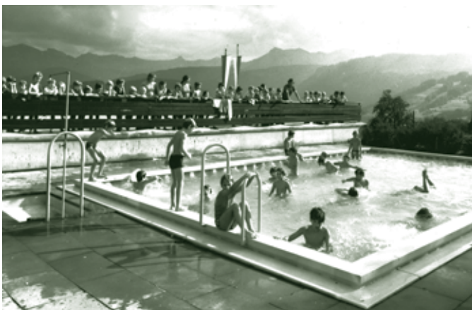
Maien-Kinder beim Schwimmen, 1974

Sammelstelle für die wechselnden Turnusse war der Parkplatz vor dem Alten Rathaus. Von dort fuhr der Maien-Bus alle 14 Tage - montags, pünktlich um 8:00 Uhr Richtung Bödele ab. Davor gab es jedoch jedes Mal ein lebendiges Durcheinander von aufgeregten Ferienkindern und dann eifrig winkenden und sicherlich manchmal auch erleichterten Mamas und Omas. Schon bei der Busfahrt übers Bödele gab es viel zu erzählen und es war richtig laut im Bus! Der Busfahrer muss Nerven wie Drahtseile gehabt haben. Am Ortsanfang von Schwarzenberg wurden wir, als sprudelnder Haufen Ferienflöhe, ausgeladen. Der Bus fuhr weiter und brachte das Gepäck noch bis zur Wiese vor dem Ferienheim. Von dort war es für uns Kinder jedes Mal „an gehöriga Schloapf“.