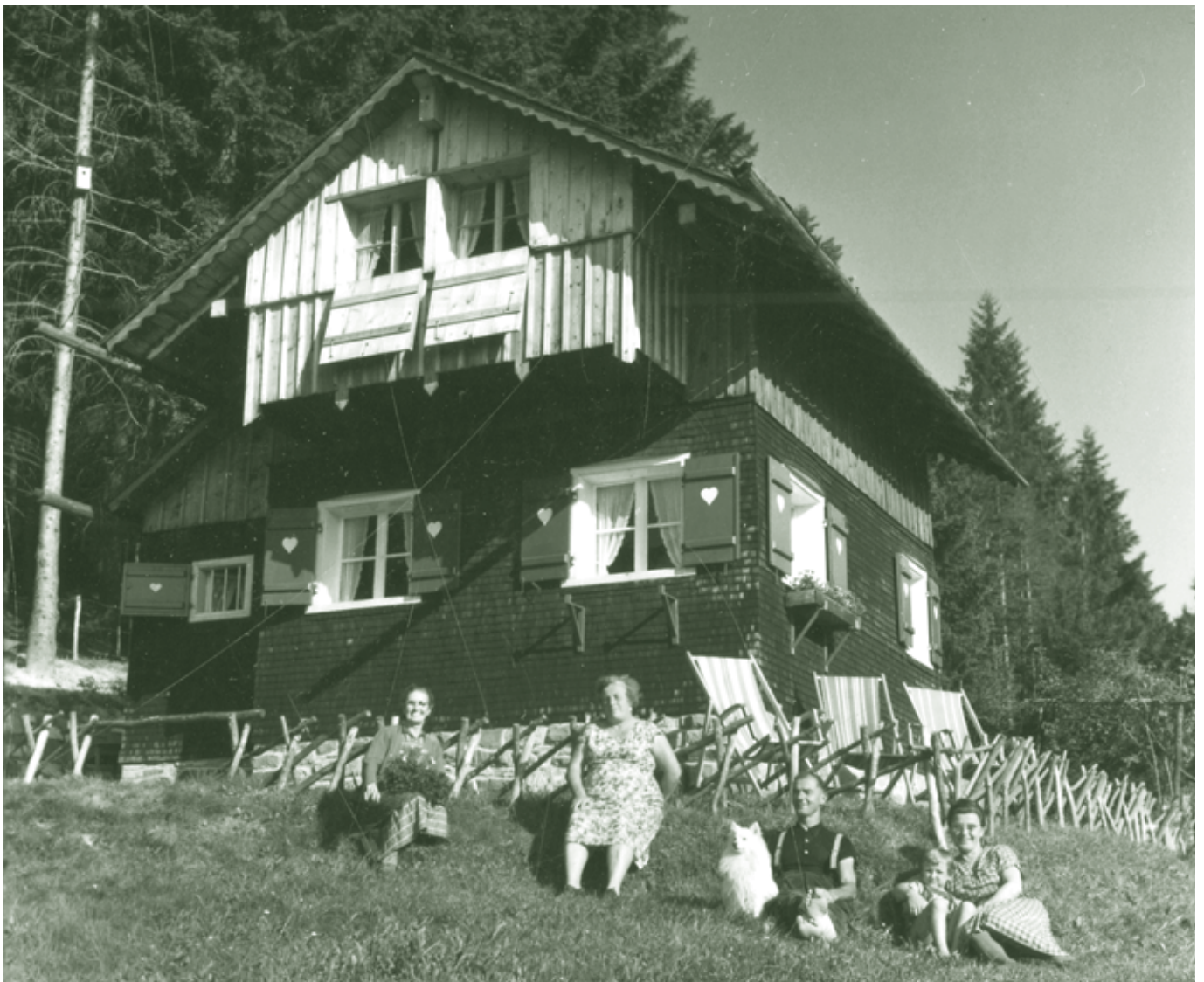
Ammenegg, 1950er Jahre

Wenn Sie, liebe Leserinnen und Leser, die Personen und den Anlass kennen, oder ähnliche Fotografien haben, melden Sie sich bitte persönlich oder telefonisch im Stadtarchiv Dornbirn, Marktplatz 11 (Helga Platzgummer, Tel. 05572 306 4904 oder per Email: helga.platzgummer@dornbirn.at )