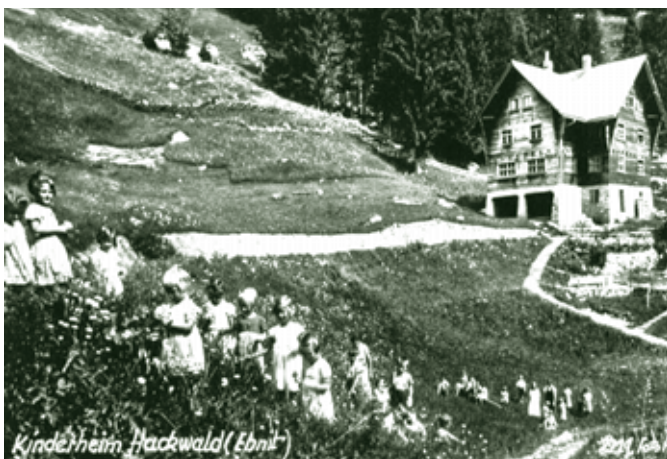
Hackwald, 1930er Jahre

Die folgenden zwei Jahrzehnte waren die Blütezeit der Ebniter Sommerfrische-Kultur. Es wimmelte von Lustenauern und anderen Feri-