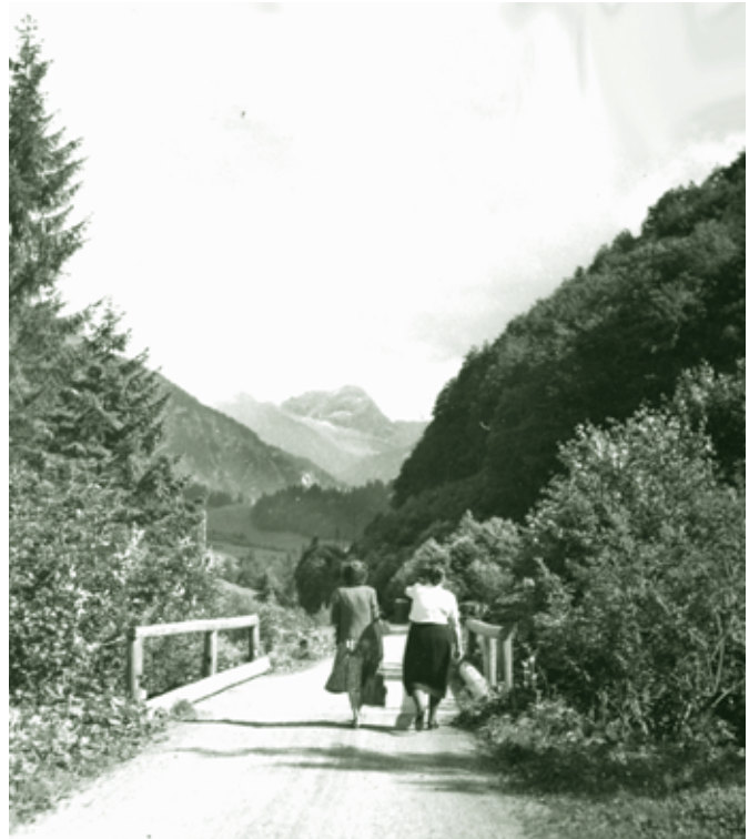
Wandern in Schoppernau um 1950