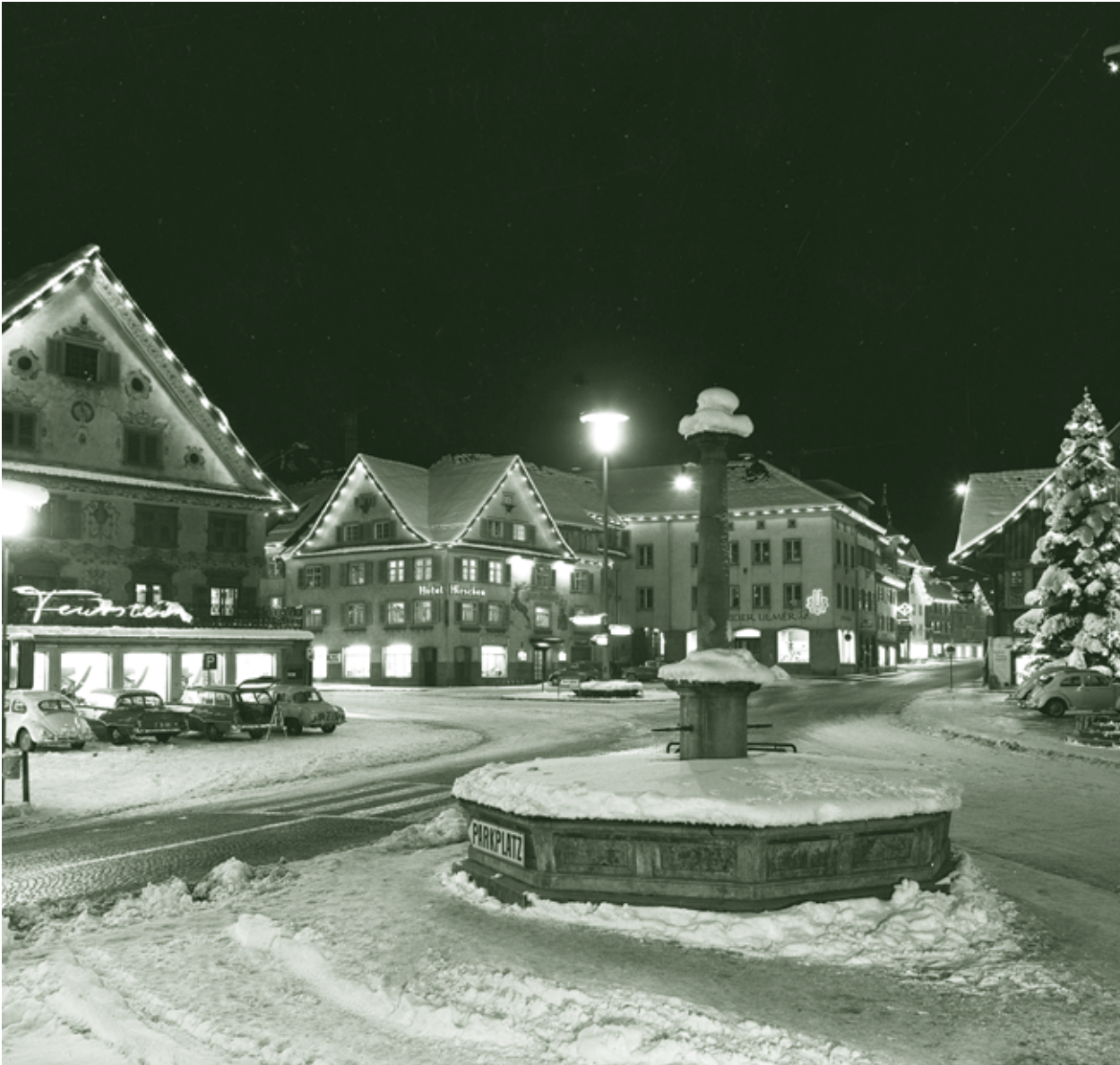
Marktplatz zur Weihnachtszeit - 1960/70er Jahre

Mit und für Senioren gestaltete Zeitung der Stadt Dornbirn Dezember 2013 / Nr. 77