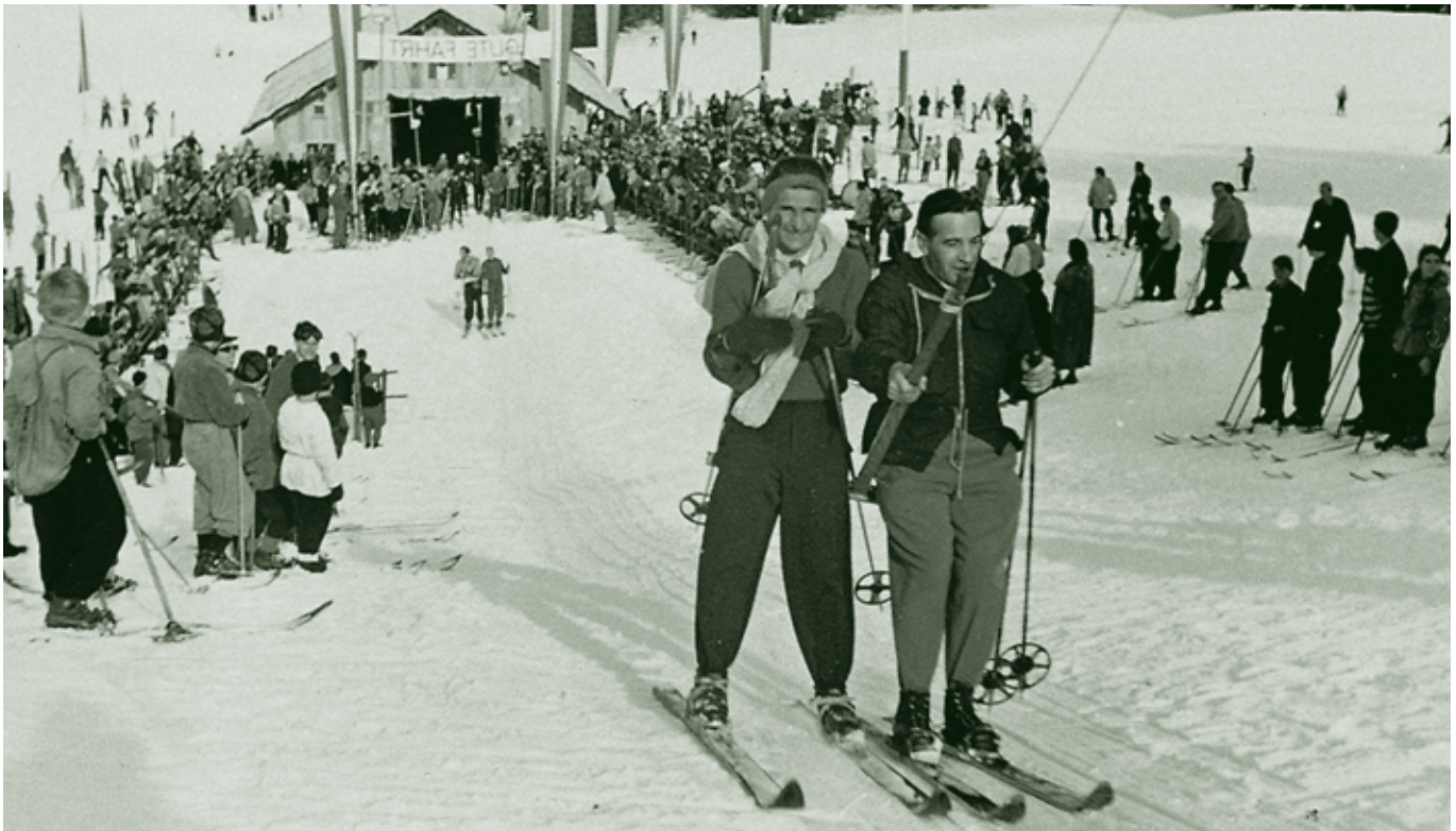
Am Tag der Eröffnung - 28. Jänner 1951

Die gerade erst entstandene Seilbahngesell-