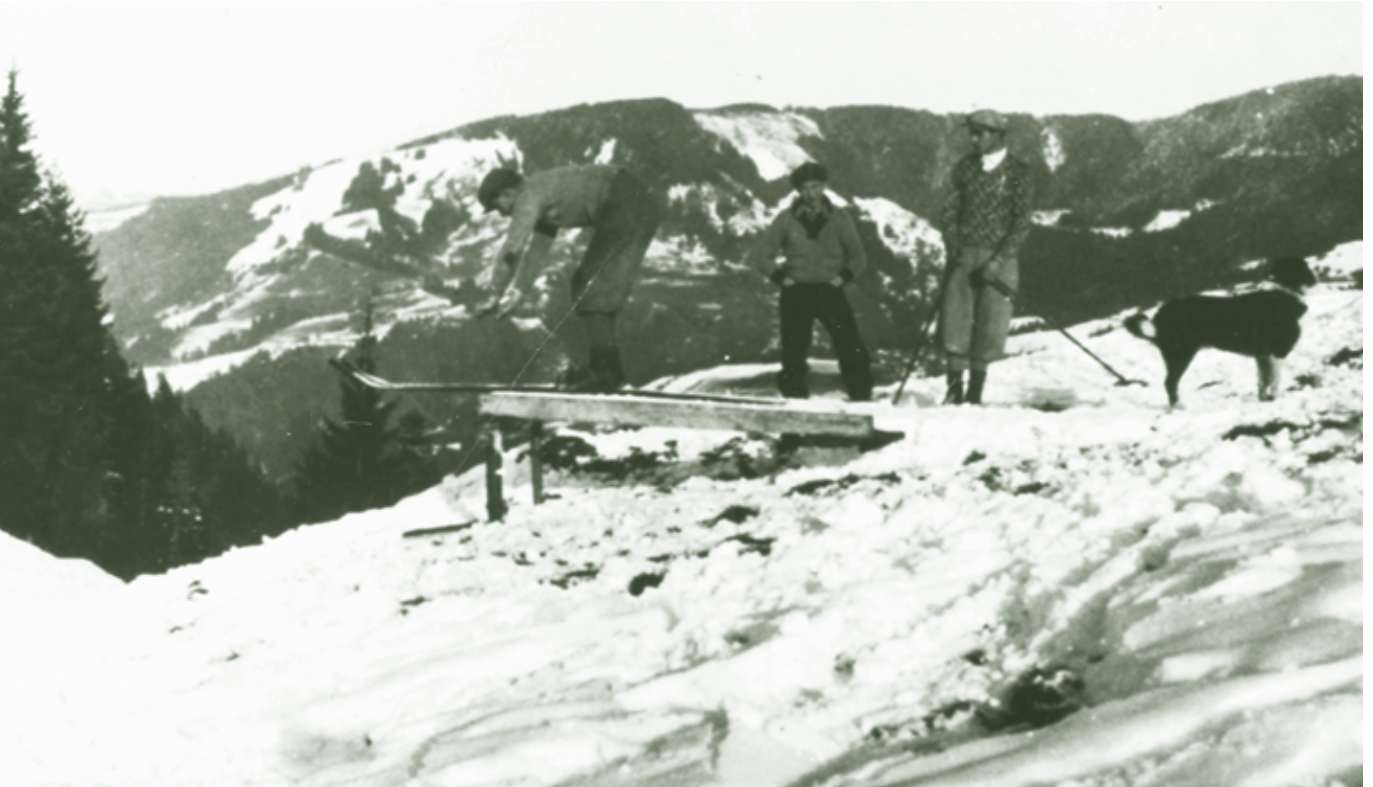
Schispringen auf einer einfachen Schanze am Bödele - 1940er Jahre

anständig durchgetreten. Dann durfte einer der Erbauer, nachdem man das Brett und die Pflöcke weggetan hatte, die erste Spur legen. Die Schanze war eine so genannte „Lüftlere“, das heißt sie ging ziemlich waagrecht bis aufwärts und beim Springen musste man verdammt aufpassen, dass man keine Oberluft bekam, sonst war ein fürchterlicher Sturz unvermeidlich. Wenn einer der sich nicht so recht traute, nur über die Schanze „drüberloh oder sogar abdruckt heot“, kam er höchstens auf zwei, drei Meter.