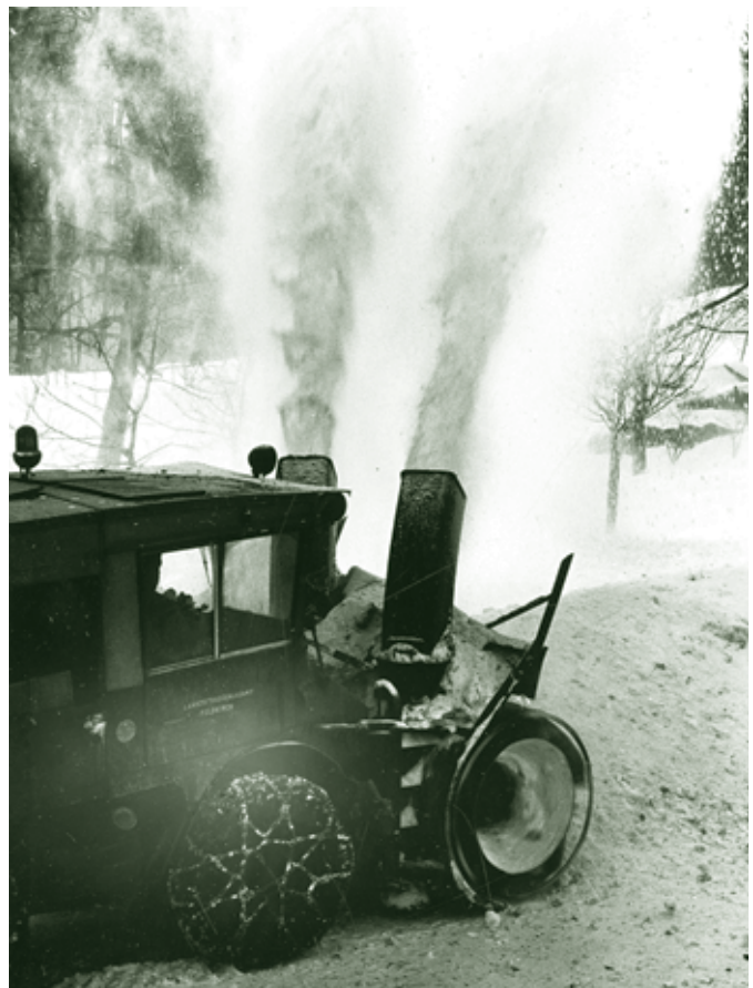
Räumung in Watzenegg mit der Schneeschleuder - 1950er Jahre

In unseren altersgrauen Erinnerungen bilden solche Dinge natürlich ein gutes Stück der einstigen Winterzeit. Aber natürlich: die Winter sind halt heute auch nicht mehr das, was sie einst waren.