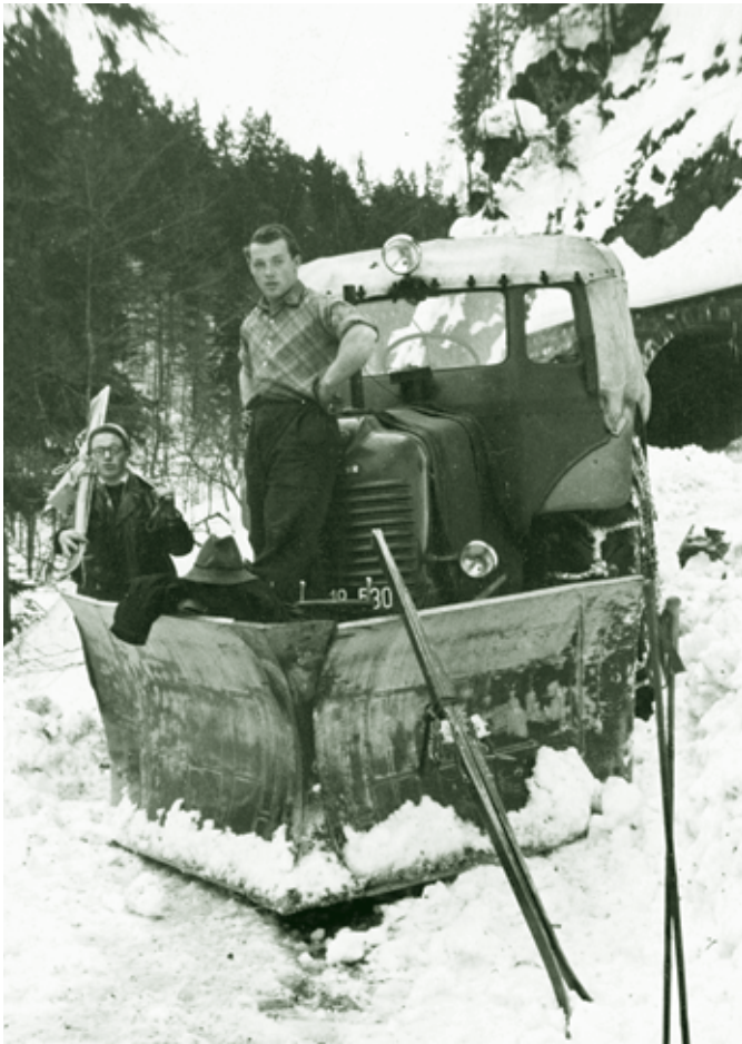
Traktor mit Schneepflug auf der Bödelestraße - 1954

Für uns Buben (wohl auch für die Mädchen) hatte die Schneeräumung mit den relativ leichten Holzpflügen den Vorteil, dass der Straßenboden meist mit einer „Schneerofe“ bedeckt blieb.