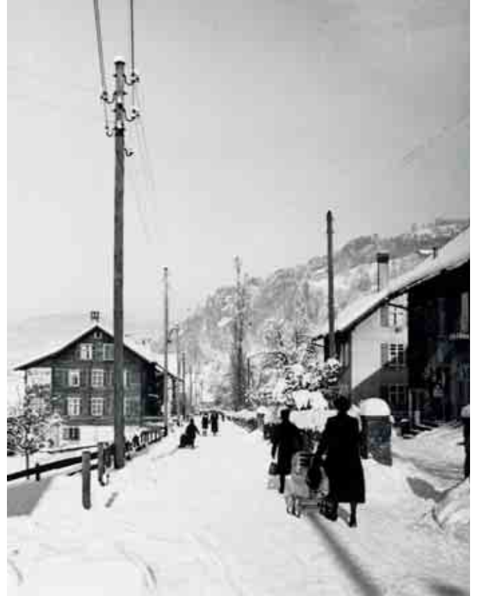
Schnee in Bündlitten - Jänner 1940

Der Wintereinbruch am 22. Oktober 1890 führte zu einem Zugstau für die Vögel, die den Weg über die