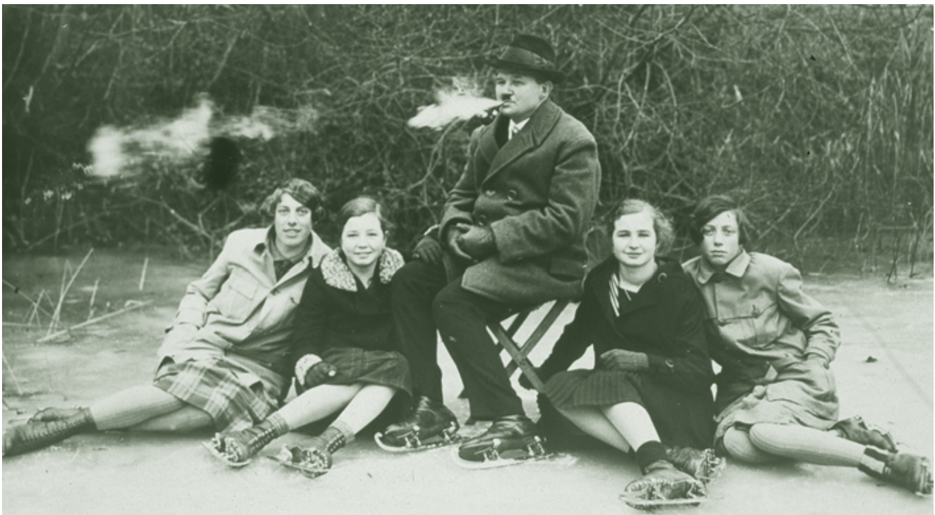
Eislaufen bei den Lehmlöchern, Nähe Ziegelei Rhomberg - 1927

Wahrscheinlich stammt der älteste bekannte Schlittschuh aus dem Jahr 5000 vor Christus. Dem Modell aus dem 19. Jahrhundert waren unzählige viele Formen vorausgegangen. Wir Schulkinder nach dem Krieg waren die letzten, die mit diesen Schlittschuhen fuhren.