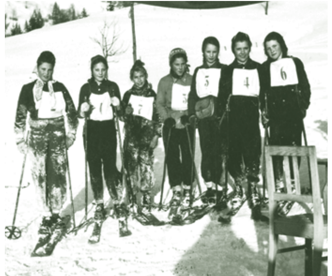
Mädchen-Schirennen - 1950

Eine Neuheit war für uns alle das Fahren auf einem Sessellift mit Schiern an den Füßen. Als Ausstiegshilfe fungierte ein älterer Mann mit grimmigem Gesicht und ebensolchem Schnurrbart. Als die erste von uns, statt ordnungsgemäß auszusteigen, sich einfach auf den Boden warf, fluchte er lautstark vor sich hin. Da auch die nächsten drei diese Aussteigmethode praktizierten, rief er der vierten zu: „Wio weords eppa ins zwoa wieder gian?“ Nur eine aus unserer Gruppe ließ sich nicht fallen, sondern fuhr, vom Sitz nur halb gelöst, in den Maschinenraum. Ihr verzwei-