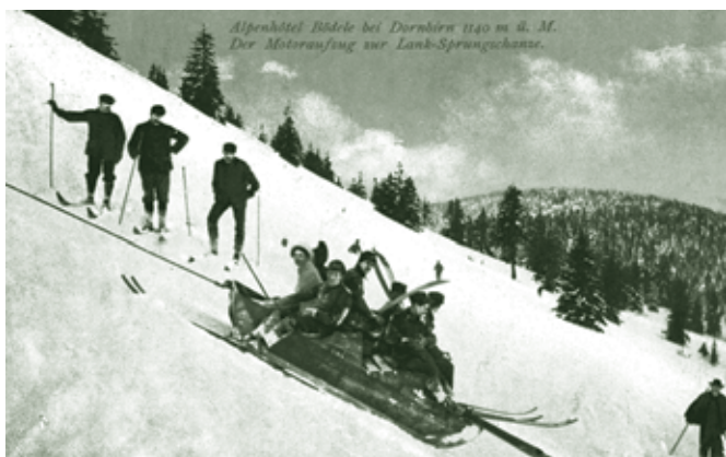
Der erste Schilift am Lank im Jahre 1907

Was nicht bekannt ist, sind die technischen Details der Anlage. Es fehlen die Angaben der För-