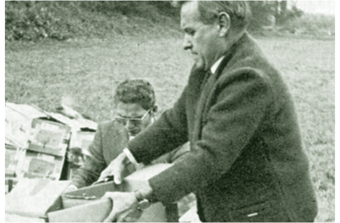
Schwalbentransport - 1974

„Hängt's Laub im November fein, wird's kalt noch länger sein“. Diese drei Bauernregeln wollen aus der Pflanzen- und Tierwelt den kommenden Wintercharakter ableiten. Tatsächlich reagieren Pflanzen und Tiere auf die Witterung und nicht umgekehrt: Der Laubfall und der Fellwechsel sind eine Reaktion auf die Nachtfröste. Alle drei Sprüche wollen also etwa sagen: Wenn der Winter spät kommt, dann wird er dafür länger oder strenger. Mit solchen Prophezeiungen sind wir bei der Problematik der Lostage oder des Hundertjährigen Kalenders. Es handelt sich dabei um alte überlieferte Wetterdeutungen und -prophezeiungen, meist mit der Annahme falscher Zusammenhänge, die astrologischen Ursprungs sind. Allein die Annahme, das Wettergeschehen wiederhole sich alle sieben Jahre (später wurden daraus 100 Jahre), ist absurd und gehört heute zum nachgewiesenen Aberglauben. Zusammenhänge zwischen heißem Sommer und kaltem Winter sind meteorologisch unsinnig und entbehren jeder Grundlage. „Macht der August uns heiß, bringt der Winter viel Eis“ - reimt sich zwar schön, ist aber durch lange