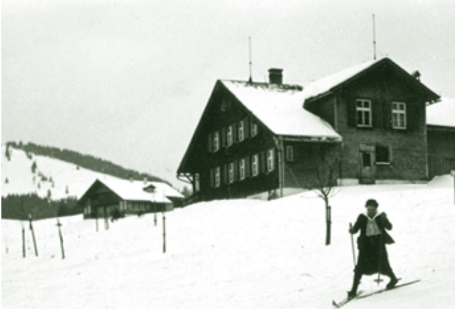
Schifahrerin mit Rock auf dem Bödele - 1920