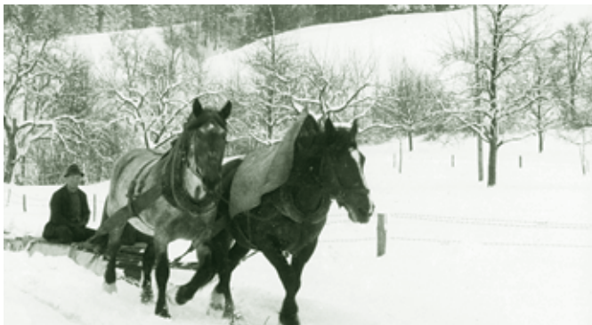
Pferde-Schneepflug - 1969

Extrem milde Winter und Frühwinter sind in großer Zahl bekannt. Darauf spielt die Bauernregel „Der Winter sieht oft dem Sommer in die Karten“ an. Schon 1606/07 wies der Dezember warme Märztemperaturen auf und es gab keine Schneedecke. 1722 musste man nach Weihnachten kaum noch heizen, 1788 war es bis 16. Jänner warm und schneelos, 1834 hatte der ganze Winter in Dornbirn keine Schneefahrbahn. Auch 1853/54, 1855/56 und 1861/62 waren warme und fast schneelose Winter. Die Oberdorfer Schulchronik berichtet, dass ein Schüler am 10. Dezember 1880 frische Schlüsselblumen mitgebracht habe. Ende Dezember 1888 blühten auch im Allgäu die Frühlingsblumen und Schmetterlinge flogen umher.