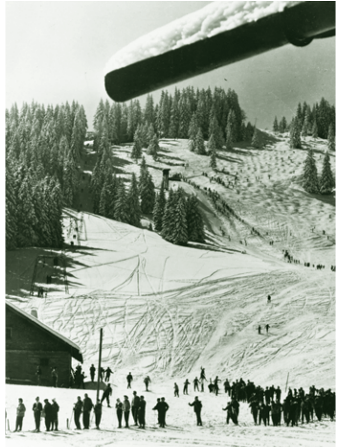
Schiparadies Bödele - 1950er Jahre