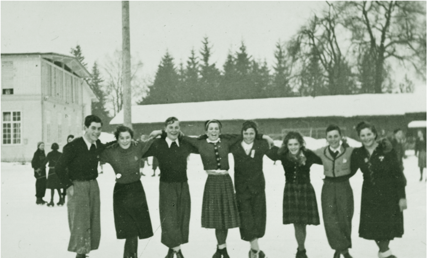
Eiskunstlauf am Fischbach, Rotfarbfabrik - 1940