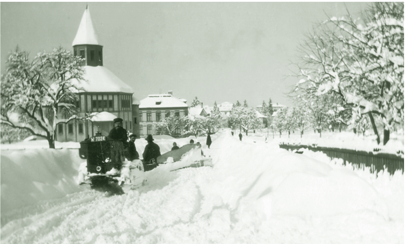
Schneepflug (Raupenfahrzeug) in der Rosenstraße - 1932

Verglichen mit den Erzählungen eines uns befreundeten Walser Bauern aus Zug bei Lech kamen uns die hiesigen winterlichen Beschwerden jedoch ziemlich komfortabel vor. Wenn wochen- und monatelang meterhoher Schnee lag, trieben die Bauern der einzelnen Gehöftgruppen bei entsprechend gefestigtem Schnee ihr Vieh zu den Nachbarn hinüber und zurück, um für den Fall eines Brandes oder einer Katastrophe einen halbwegs festgestampften Weg zueinander zu haben.