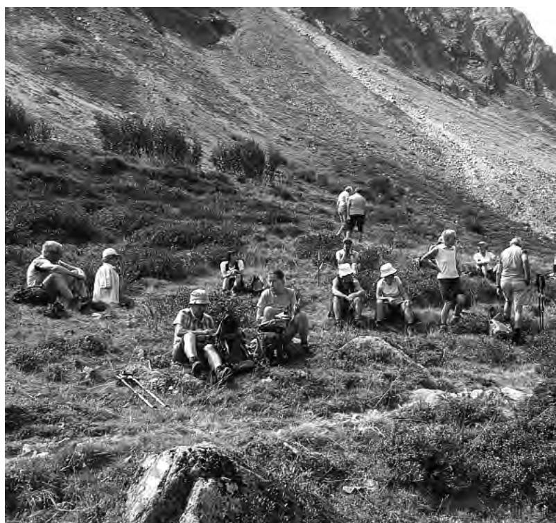
Verdiente Pause