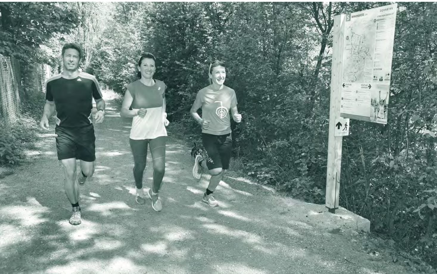
Das Laufstreckennetz bietet für alle Leistungsniveaus die passende Strecke.