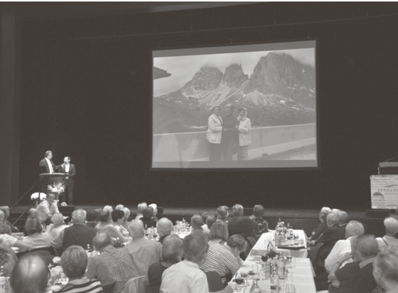
Der Rückblick in Bildern auf die Jahrzehnte