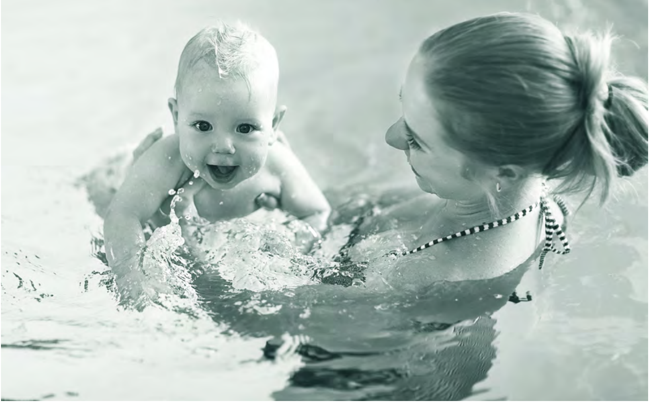
Babys fühlen sich im Wasser wohl.