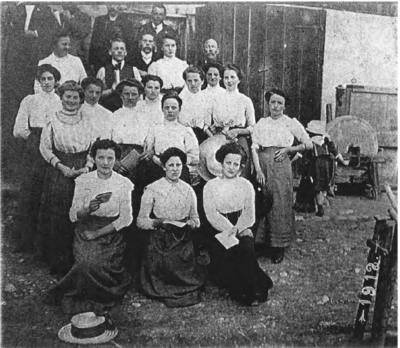
Kneipp-Ausflug nach Emsreute, 1912