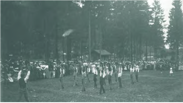
Turnübungen in der Enz um 1900