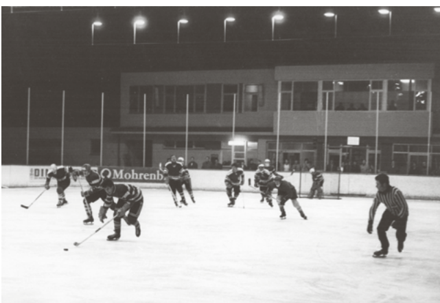
Eishockeyclub Dornbirn im Jahr 1970