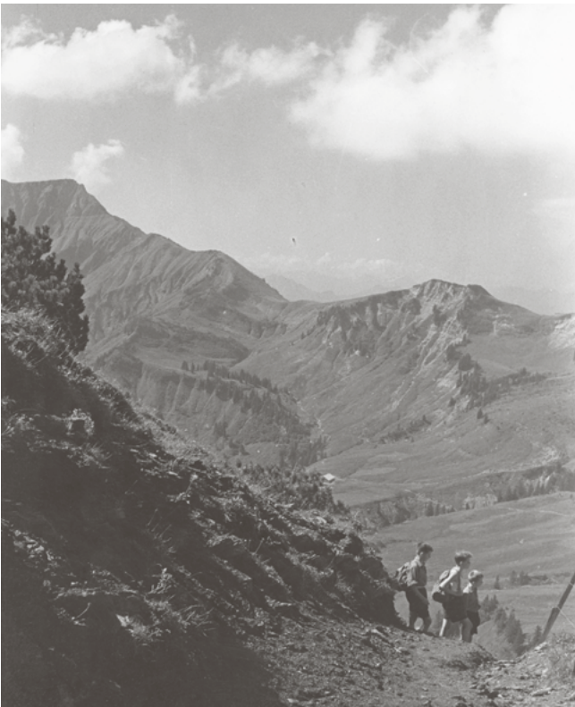
Wandern am First 1967 | Foto: Stadtarchiv, Sign. 60310