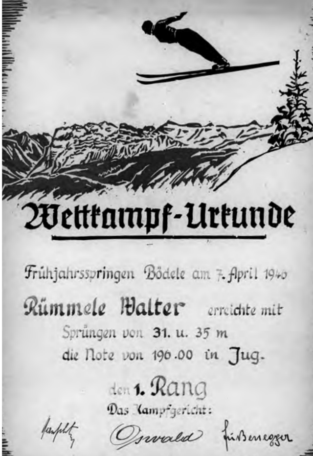
Wettkampf-Urkunde vom Bödele Frühjahrsspringen, April 1946

raschte sie einst – noch bevor sie geheiratet hatten – mit einem neuen Paar Ski vom Fussenegger aus Dornbirn.