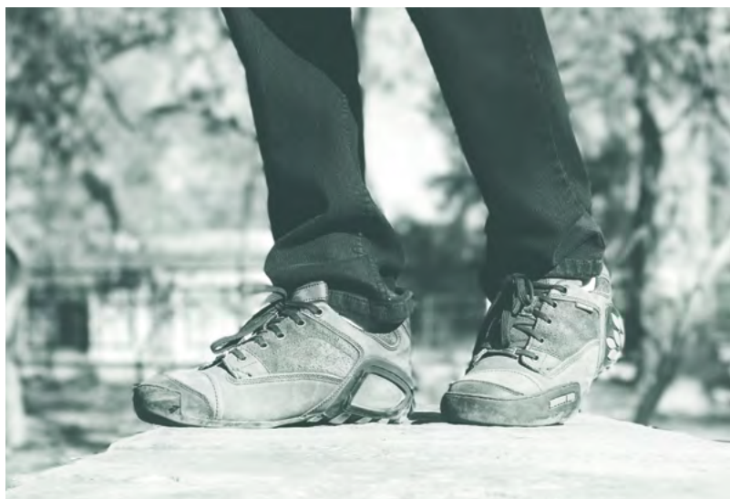
Gute Schuhe und etwas Motivation; mehr braucht es nicht, um den „Jungbrunnen Gehen“ anzuzapfen.

Was sind die Ursachen dafür, dass Bewegung im mittleren und hohen Alter Krankheit und Lebensdauer günstig beeinflussen? Wie schon erwähnt, senkt regelmäßige Bewegung Blutdruck, Cholesterin und Blutzucker. Das bedeutet eine Verhinderung von Gefäßverkalkung und damit einen Schutz vor Herzinfarkt und Schlaganfall. Moderate Bewegung stärkt das Immunsystem, was unter anderem zu einer selteneren Entstehung und einem günstigeren Verlauf von Krebserkrankungen führt. Bewegung baut körpereigene Stresshormone ab und dämpft die Aktivität des Zentralnervensystems, das bedeutet mehr innere Ruhe und Ausgeglichenheit. Die vermehrte Ausschüttung von morphinähnlichen Substanzen durch Bewegung wirkt antidepressiv und steigert damit das Wohlbefinden. Jeder von uns kann das aus eigener Erfahrung bestätigen: Nach einem ausgedehnten Spaziergang fühlen wir uns meist frisch und aktiv, Probleme, die uns vor der körperlichen Aktivität beschäftigt haben, scheinen plötzlich verschwunden oder gelöst.