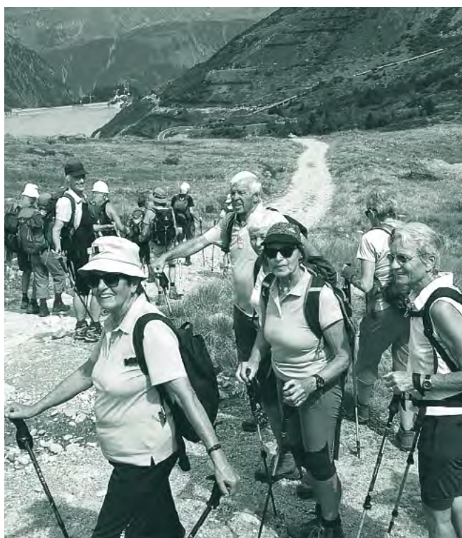
Tolle Stimmung

Rappenlochschlucht – Staufensee – Alplochschlucht Kehlegg über Gschwendalpe – Bödele/Hochälpele Ammenegg – Alpe Schwende Karren – Staufensee – Gütle Karren – Staufenalpe – Schuttannen (Staufenrundgang) Bödele – Fohramoos Karren – Schuttannen – Ebnit Alploch – Kirchle – Amannsbrücke Gütle