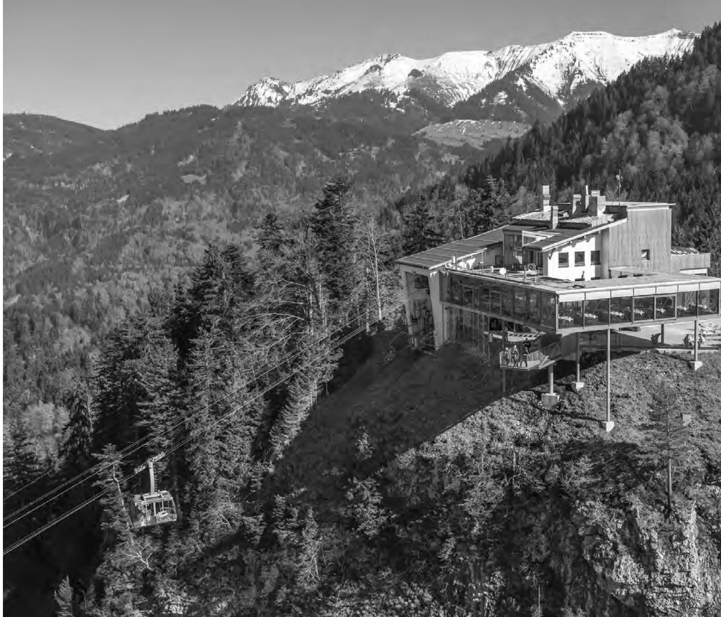
Karren Kante