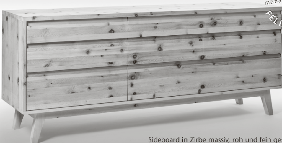
Sideboard in Zirbe massiv, roh und fein geschliffen