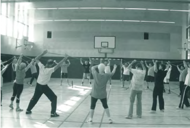
Gymnastik und Krafttraining am Seil