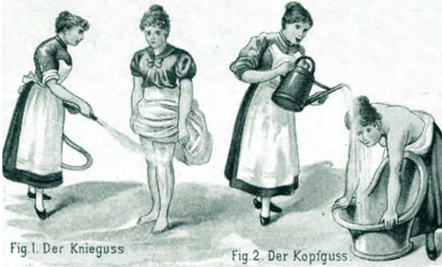
Fig. 1. Der Knieguss.