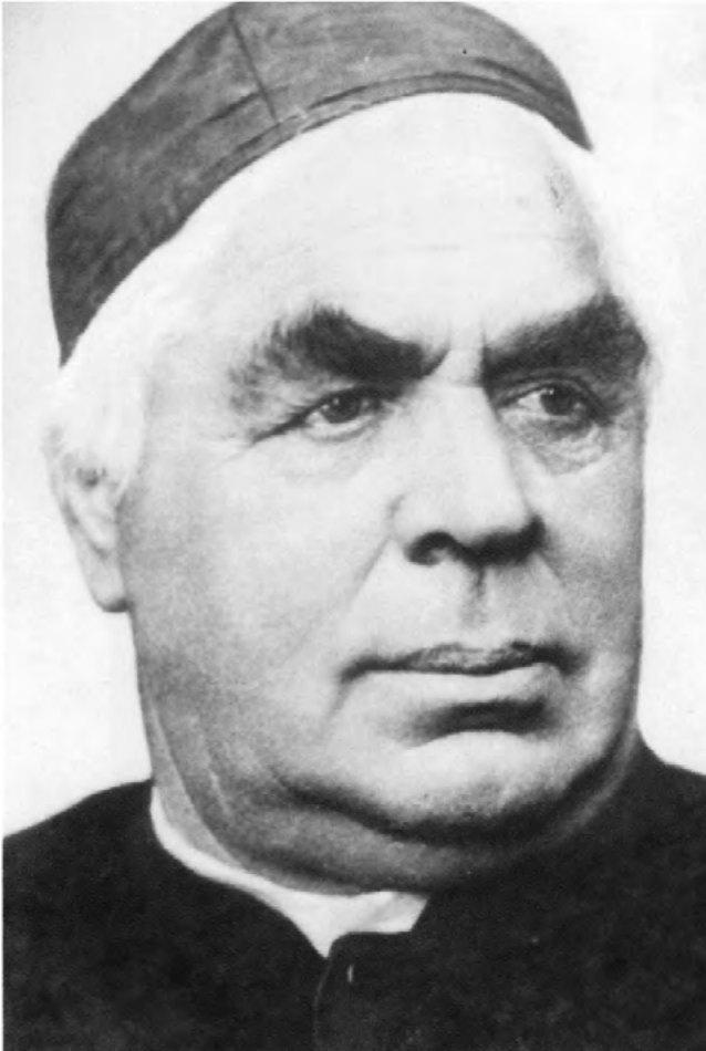
Prälat Sebastian Kneipp

Der Priester Sebastian Kneipp (1821 bis 1897) aus dem bayrischen Stephansried entdeckte um etwa 1850 die heilende Wirkung des Wassers und entwickelte ein in der Praxis erprobtes System von Wassergüssen und -kuren. Im Zusammenwirken mit Heilkräutern und Anleitungen zu gesunder Lebensweise bildete sich das System als Fünf-Säulen-Therapie (Wasser - Bewegung - Ernährung - Kräuter - Ordnung) zu einer ganzheitlichen Medizintradition.