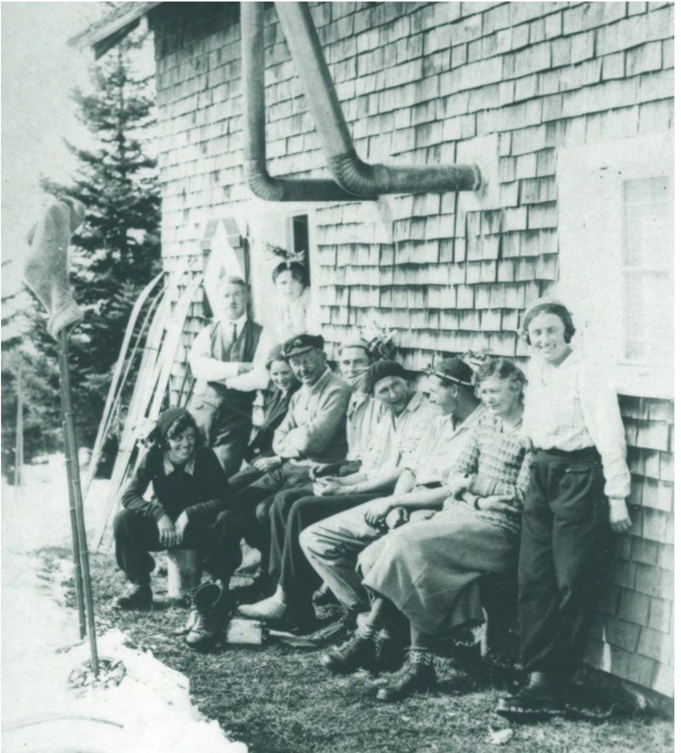
Schitag im Rudach 1937