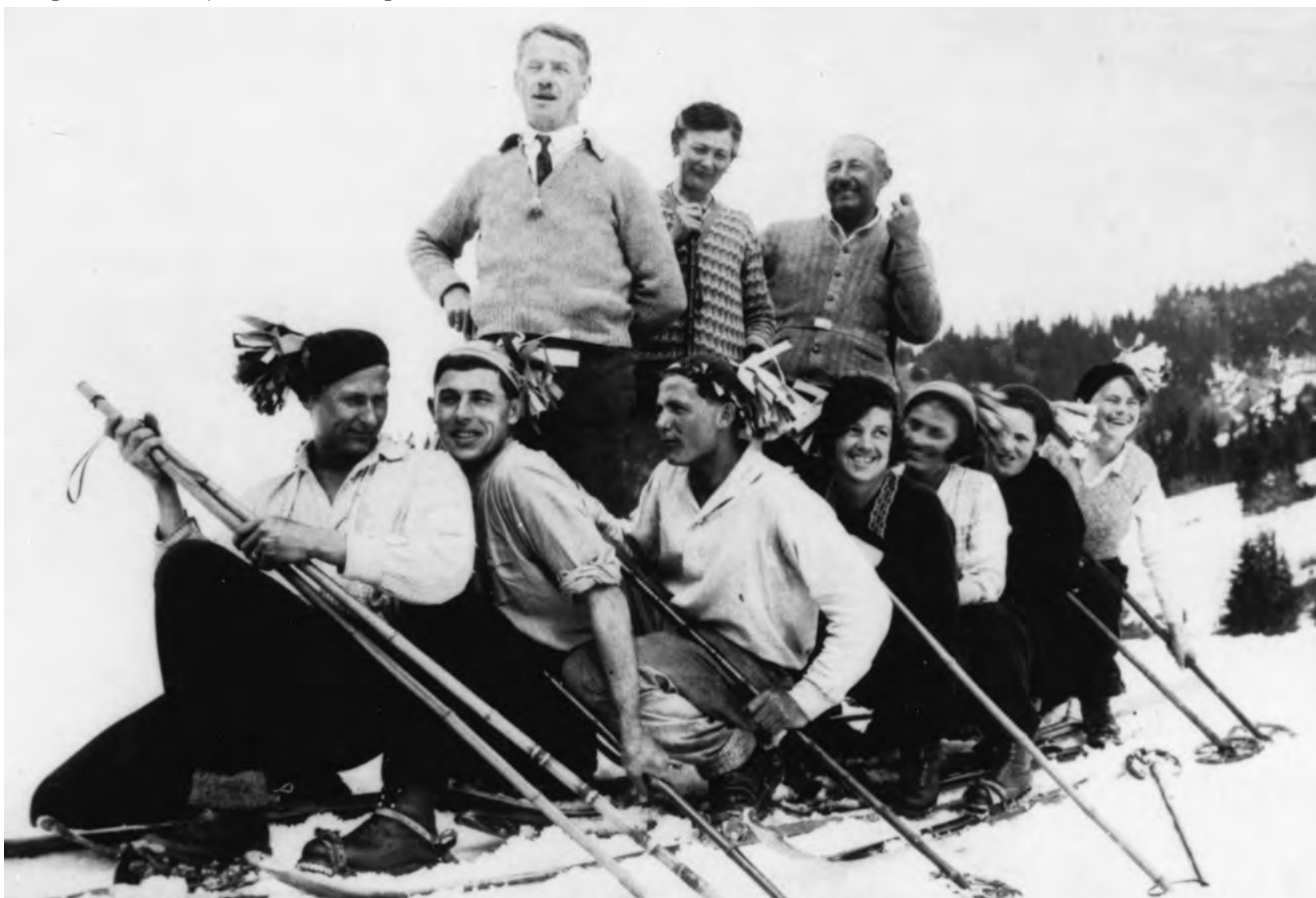
Skitag im Rudach 1937

Falls Sie Hinweise haben, melden Sie sich bitte im Stadtarchiv Dornbirn, Marktplatz 11 Philipp Wittwer, T +43 5572 306 4906 philipp.wittwer@dornbirn.at