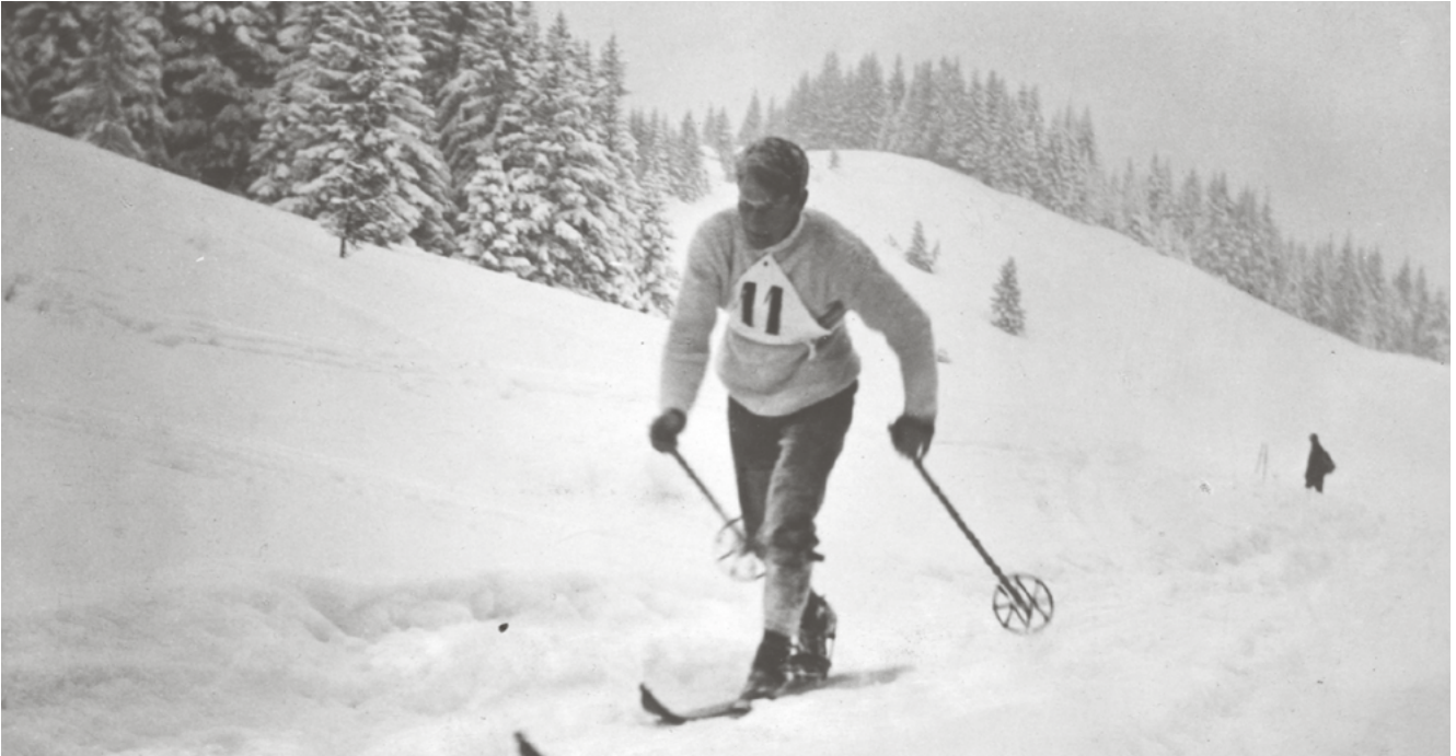
Lauritz Bergendahl, der erste Skistar der Welt, am Bödele 1912