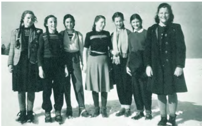
Skitag am Bödele