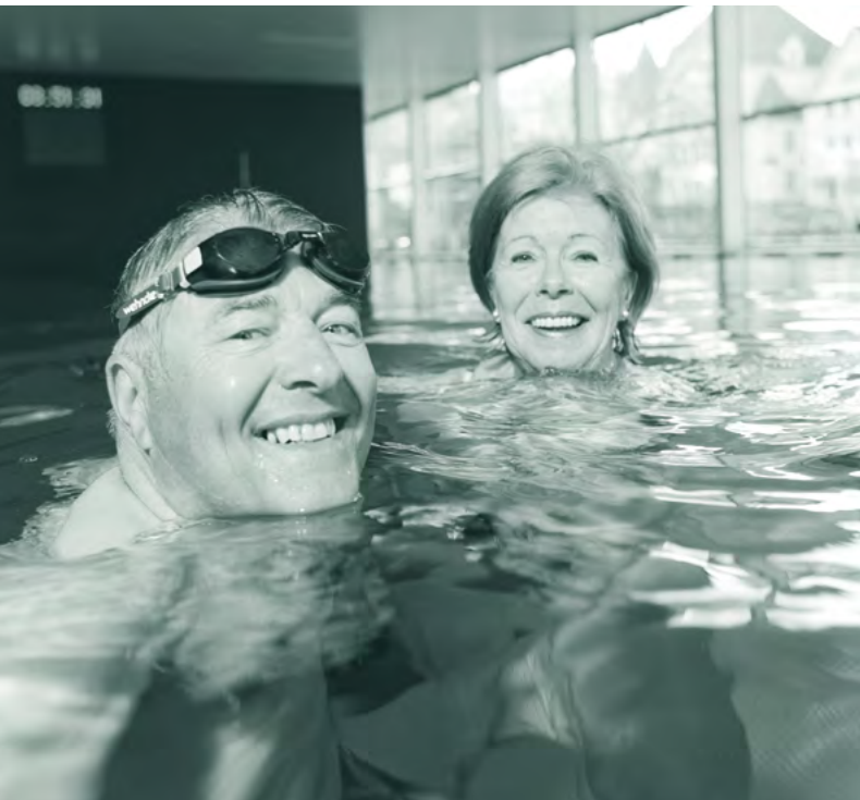
Frühschwimmer | Foto: Dornbirner Sport- und Freizeitbetriebe GmbH

In Dornbirn gibt es ein vielfältiges Angebot um die Fitness zu stärken und das für Senioren meist zum Sonderpreis . Ob Frühling, Sommer, Herbst oder Winter, es gibt immer eine passende Möglichkeit. Beginnen wir im schönen Stadtbad in der Schillerstraße. Gleich nach dem bekannten Mammutbaum hat die Bade- und Wellnesseinrichtung ihren Sitz. Sie ist ganz einfach mit dem Stadt- und Landbus zu erreichen. Dafür gibt es selbstverständlich auch spezielle Seniorenangebote. Im Hallenbad angekommen, steht ein breites Angebot für die Besucherinnen und Besucher jeden Alters zur Auswahl: Badebereich, Massage, Wellness und Sauna.